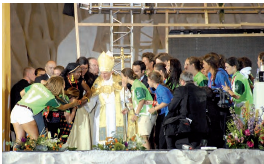
Un “joven” entre los jóvenes.

acoger futuros eventos de gran envergadura internacional. Pensemos, por ejemplo, en unos Juegos Olímpicos o en un mundial deportivo de cualquier clase. También hay que destacar el tesón de los peregrinos, sometidos a los rigores del clima estival de Madrid. Fueron días de mucho calor y hasta tuvimos la sorpresa de una fuerte tormenta en la tarde del sábado, así como el paso del viento matinal del domingo. Nada frenó su entusiasmo y las ganas de estar presentes en la JMJ. A pesar de todo, hicieron la Vigilia, escucharon en silencio la Misa y el mensaje del Papa. Después, los peregrinos, muchos siguiendo sus banderas nacionales o regionales, con un cansancio que se ocultaba en su entusiasmo, fueron abandonando en orden y tranquilamente las instalaciones de Cuatro Vientos. Fue de agradecer en esos momentos escuchar las voces de los