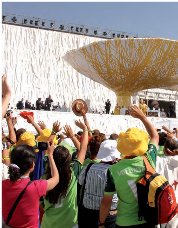
Benedicto XI saluda a la multitud congregada.

El gran acontecimiento de la JMJ en Cuatro Vientos se ha concentrado esencialmente en la zona de vuelo, a la que esos días se denominó “parce-