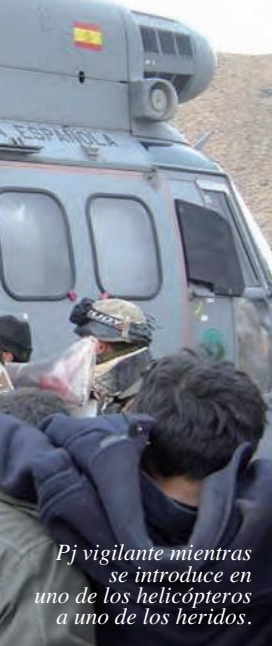
Pj vigilante mientras se introduce en uno de los helicópteros a uno de los heridos.