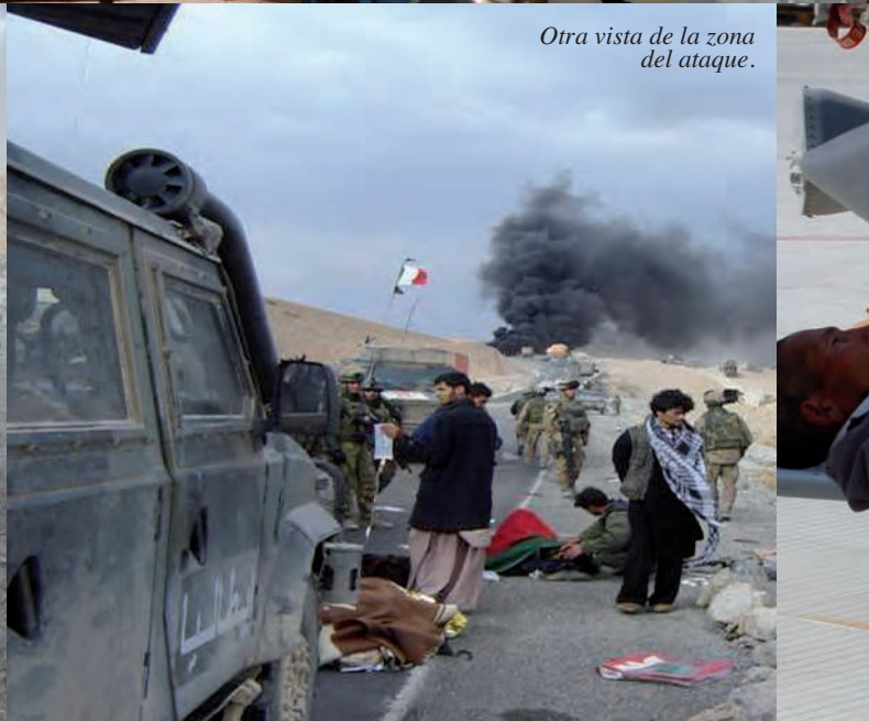
Otra vista de la zona del ataque.