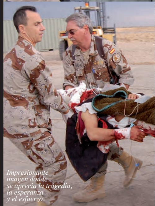
Impresionante imagen donde se aprecia la tragedia, la esperanza y el esfuerzo.

al equipo médico y personal de operaciones especiales. Despegará inmediatamente para dar zona segura y autorización para que el segundo helicóptero aterrice y recoja a los heridos que aparentemente estén menos graves pero no más de dos. Este segundo helicóptero realizará las maniobras en el menor tiempo posible y despegará para pasar a realizar labores de escolta y permitir que de nuevo el líder tome. El líder tomará y recogerá a los heridos más críticos y que precisen más atención. Realizadas todas las maniobras se procederá a la base de Herat donde el personal médico del hospital espera con todo preparado.