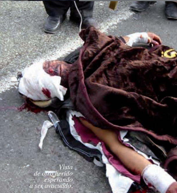
Vista de otro herido esperando a ser avacuado.