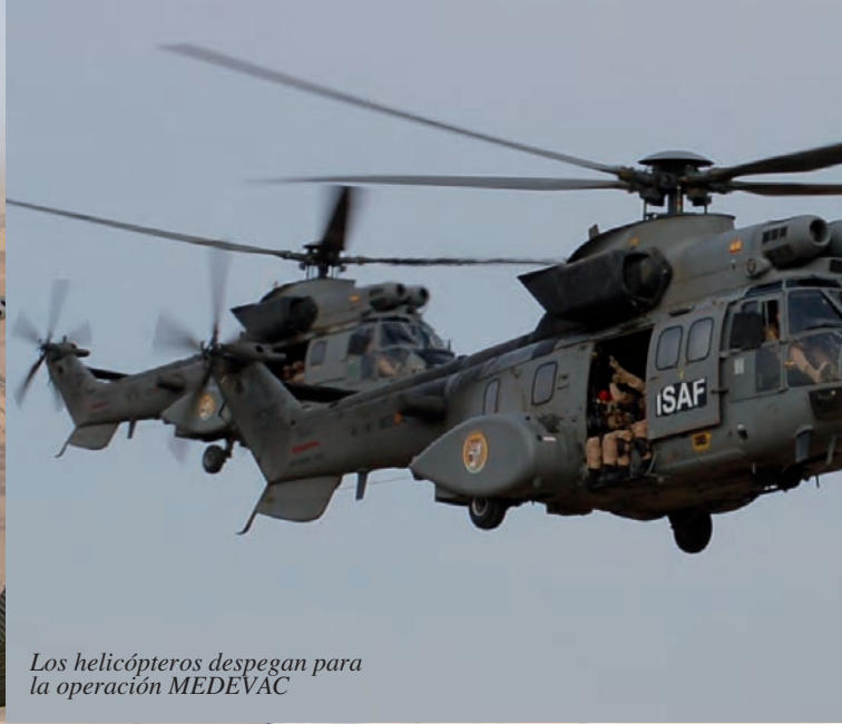
Los helicópteros despegan para la operación MEDEVAC