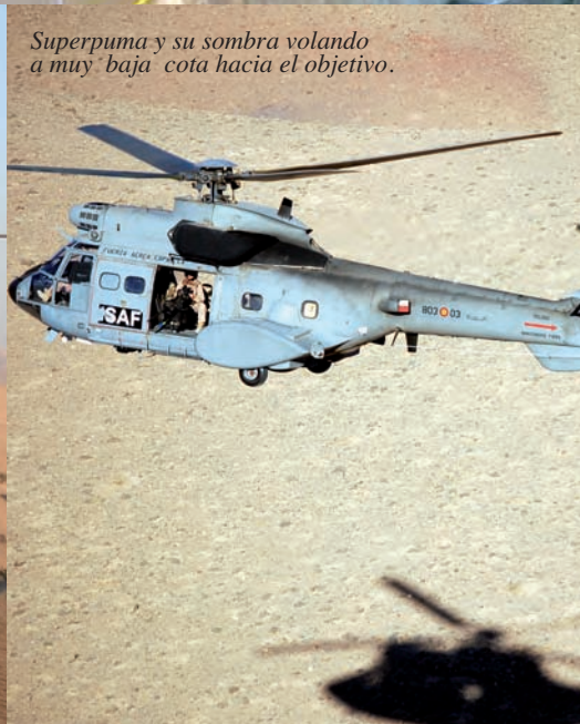
Superpuma y su sombra volando a muy baja cota hacia el objetivo.