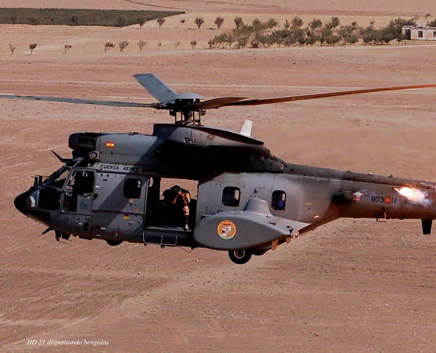
HD.21 dispensando bengalas.

adrenalina corre y realizamos una maniobra evasiva para ocultarnos tras las montañas.