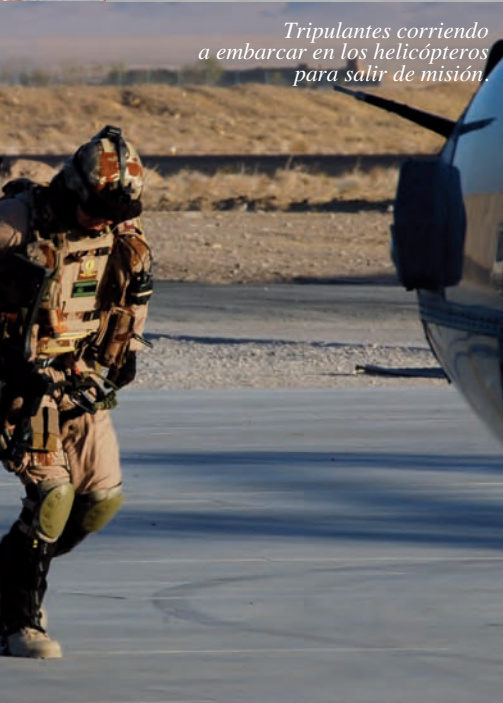
Tripulantes corriendo a embarcar en los helicópteros para salir de misión.