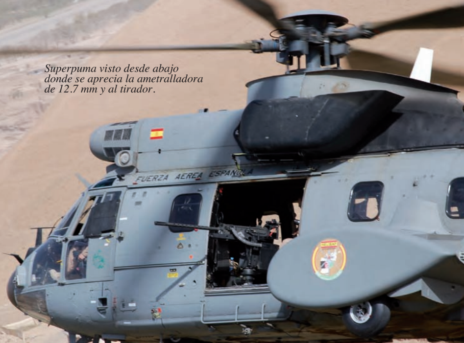
Superpuma visto desde abajo donde se aprecia la ametralladora de 12.7 mm y al tirador.