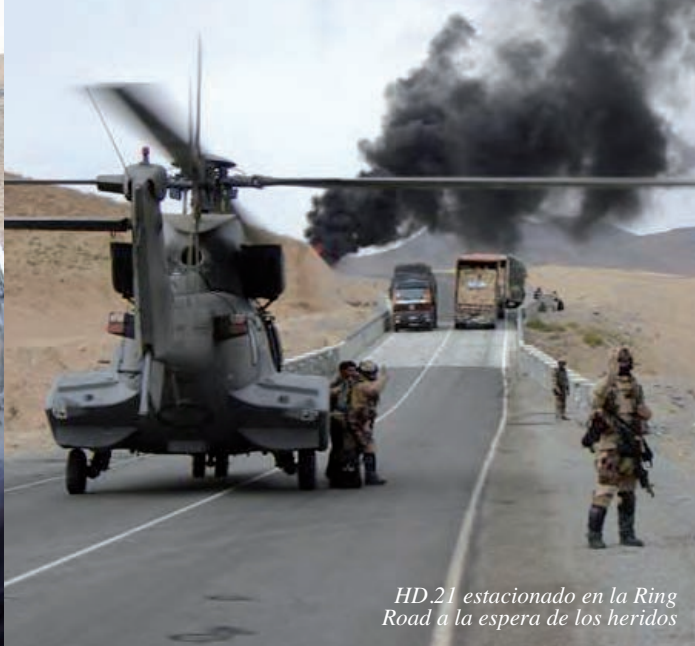
HD.21 estacionado en la Ring Road a la espera de los heridos