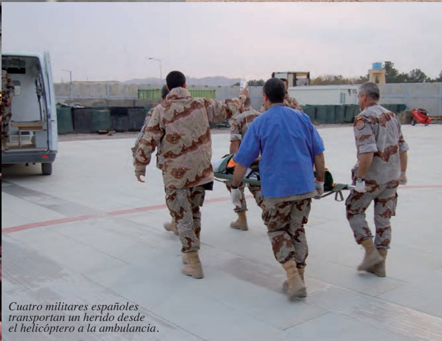
Cuatro militares españoles transportan un herido desde el helicóptero a la ambulancia.

La decisión está tomada y ésta será la forma de actuar. ¡El tiempo en zona será mayor!. Las entradas y salidas en el lugar del ataque son las más críticas y el combustible está muy ajustado. Habrá que medir cada uno de los movimientos y no tener contratiempos. “hay que ir muy rápido, chicos”.