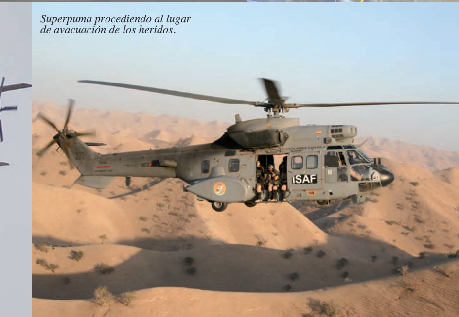
Superpuma procediendo al lugar de evacuación de los heridos.