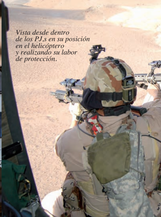
Vista desde dentro de los PJ,s en su posición en el helicóptero y realizando su labor de protección.