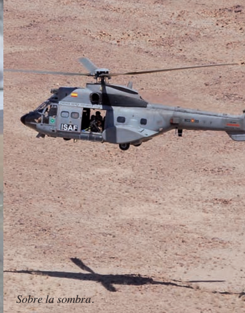
Sobre la sombra.