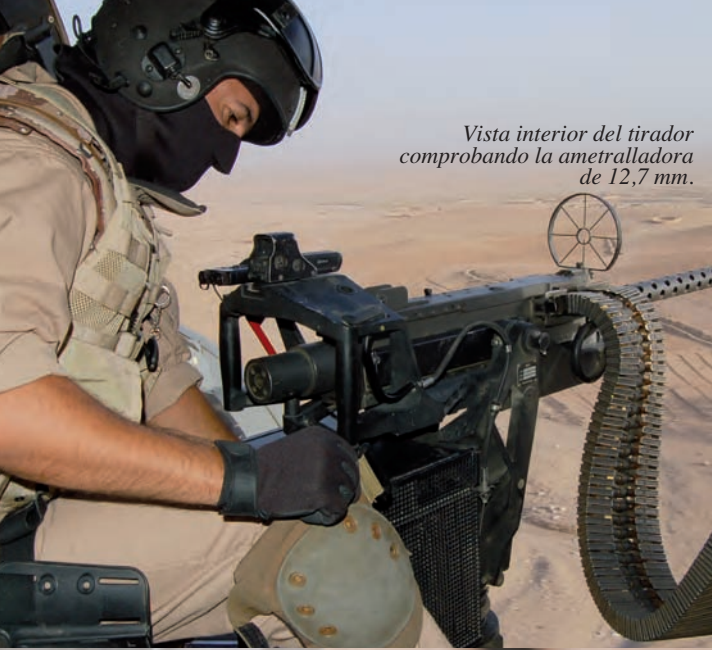
Vista interior del tirador comprobando la ametralladora de 12,7 mm.