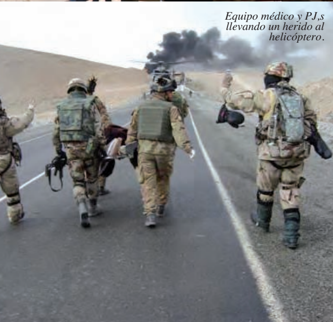
Equipo médico y PJ,s llevando un herido al helicóptero.