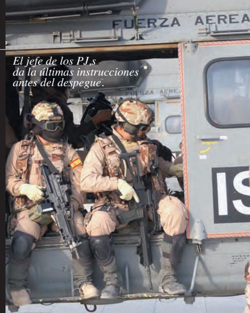
El jefe de los P.J.s da la últimas instrucciones antes del despegue.

El proceso de información y decisión se hace lo más rápidamente posible. Hay que saber dónde se ha producido el ataque (autonomía y radio de acción), si es o no factible hacer el rescate con helicóptero (elevación, estacionario con y sin efecto suelo, etc), qué tipo de seguridad hay en la zona (amenaza, número de insurgentes, etc), cómo es la meteorología (viento, visibilidad, temperatura, etc), quién será nuestro enlace en tierra, frecuencia de