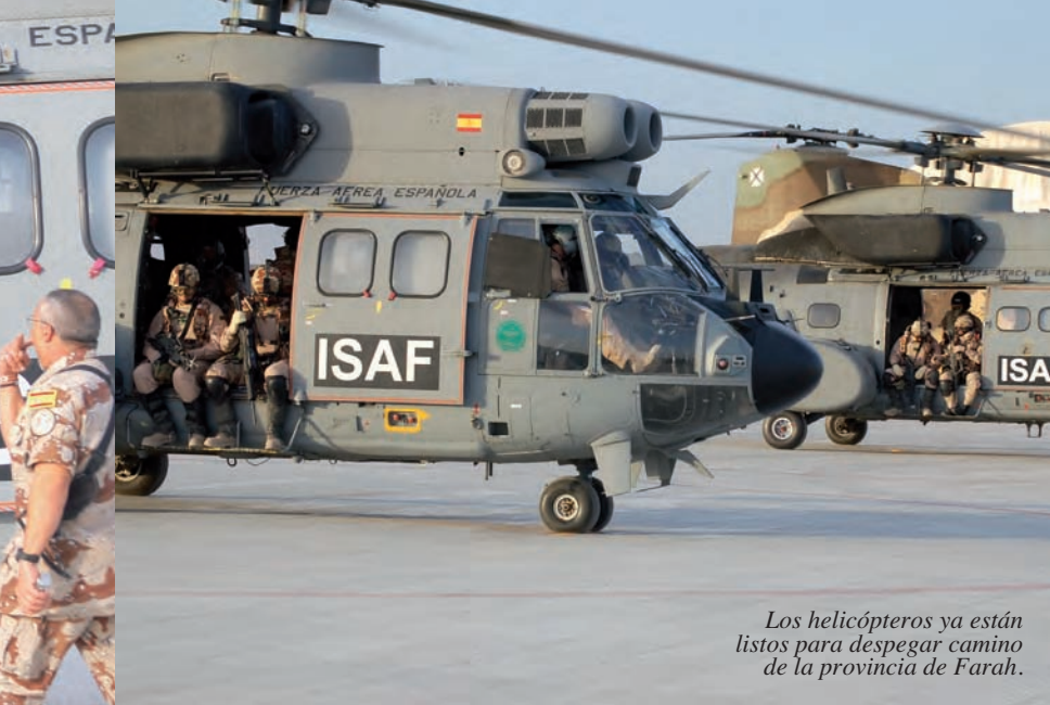
Los helicópteros ya están listos para despegar camino de la provincia de Farah.