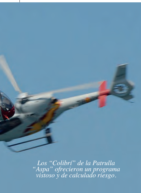
Los “Colibrí” de la Patrulla “Aspa” ofrecieron un programa vistoso y de calculado riesgo.