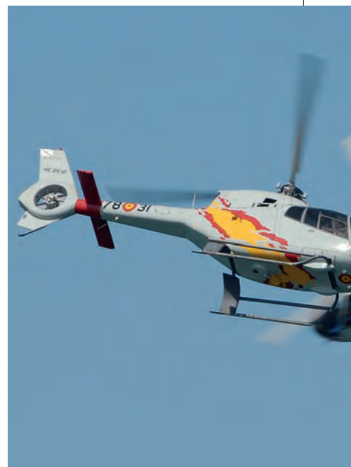
El “Puma” del SAR, en el curso de su demostración de salvamento marítimo