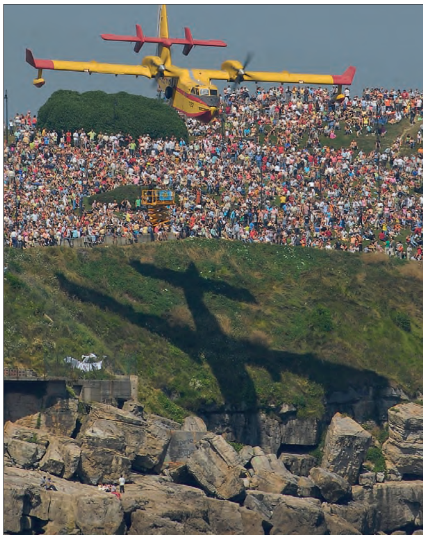
En esta originalísima foto, vemos al “Botijo” lanzándose al agua sobre el Cerro de Santa Catalina, en el que, curiosamente, proyecta su sombra.