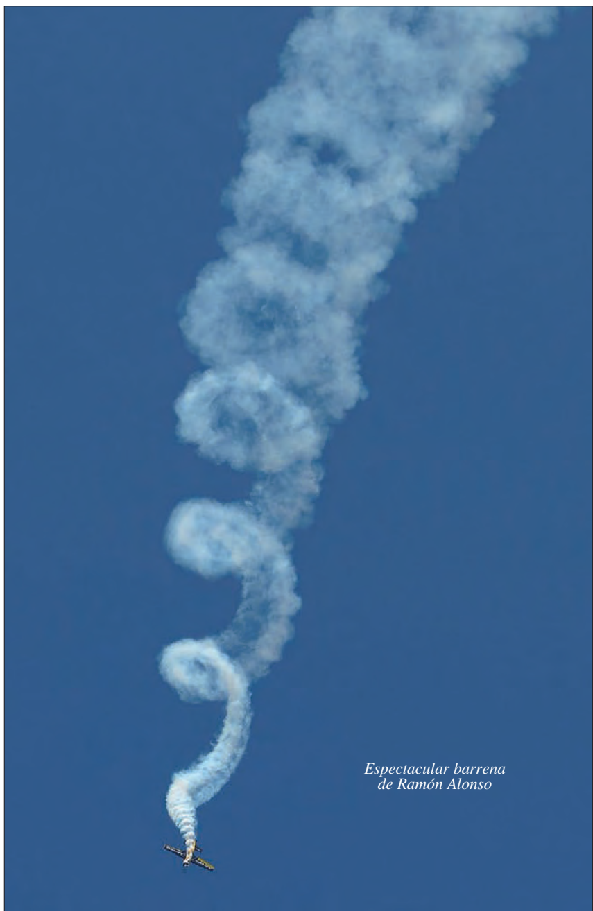
Espectacular barrena de Ramón Alonso