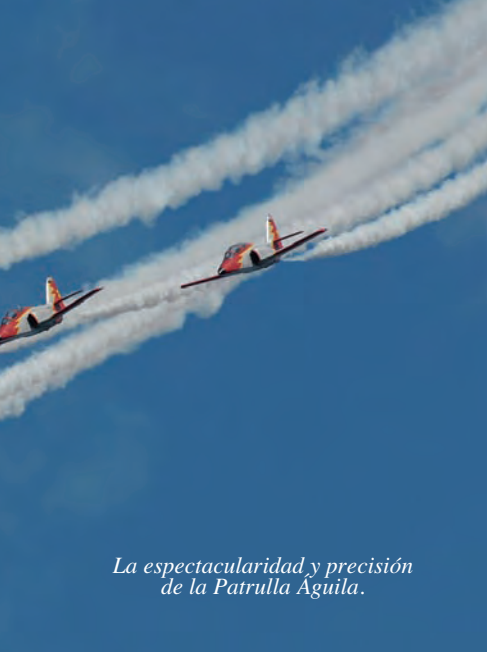
La espectacularidad y precisión de la Patrulla Águila.