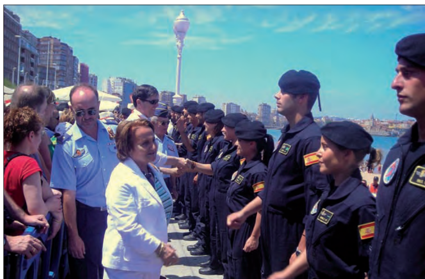
Satisfecha tras su exhibición, la alcaldesa de Gijón saluda a los miembros de la PAPEA.

tó, realizaron un salto de precisión exhibiendo las banderas de cajAstur –patrocinadora junto al Ayuntamiento, del festival– y del tan querido Sporting.