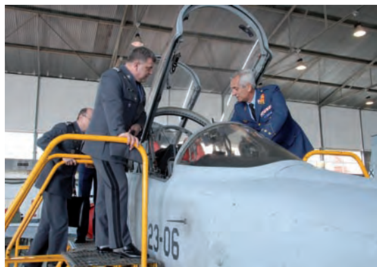
Visita del JEMA de Polonia

En este sentido, se está haciendo un esfuerzo para modernizar y potenciar la capacidad SAR; se han adquirido dos helicópteros Puma con configuración de búsqueda y rescate que han sido entre-