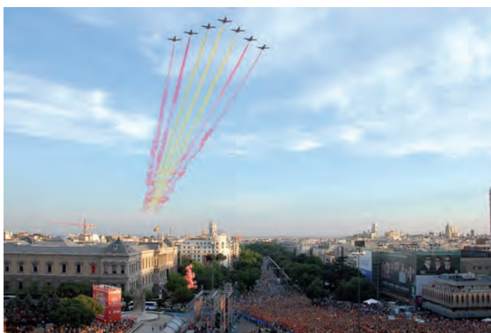
Pasada de la Patrulla Águila sobre el Paseo de la Castellana en los actos de celebración por la consecución de la Eurocopa de Fútbol

En junio de 2008 se entregó la estación portátil perteneciente al programa "Reccelite" en su versión mejorada y se han realizado varios vuelos con el Ala 12 para su certificación. Por otro lado se