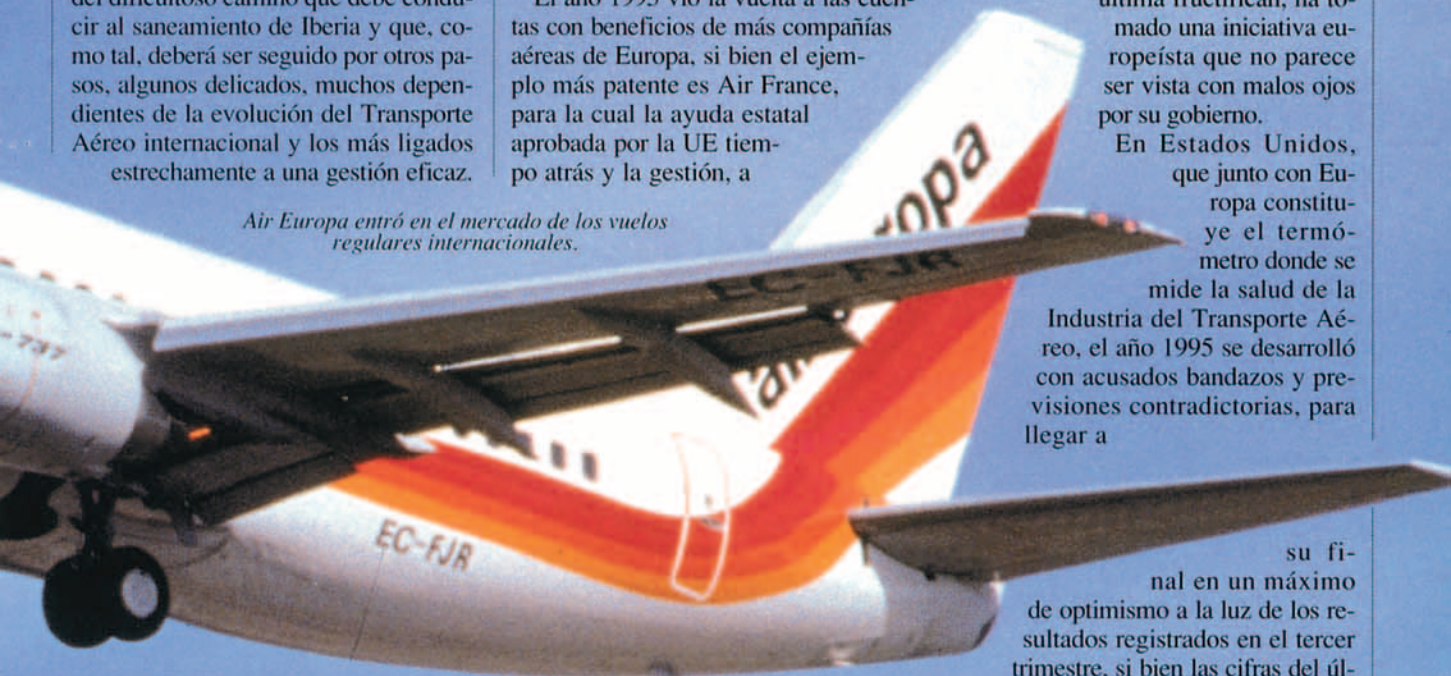
Air Europa entró en el mercado de los vuelos regulares internacionales.

El otro, de no menos importancia, es que la UE no ha regalado nada, son los contribuyentes españoles quienes van a financiar esa ampliación de capital.