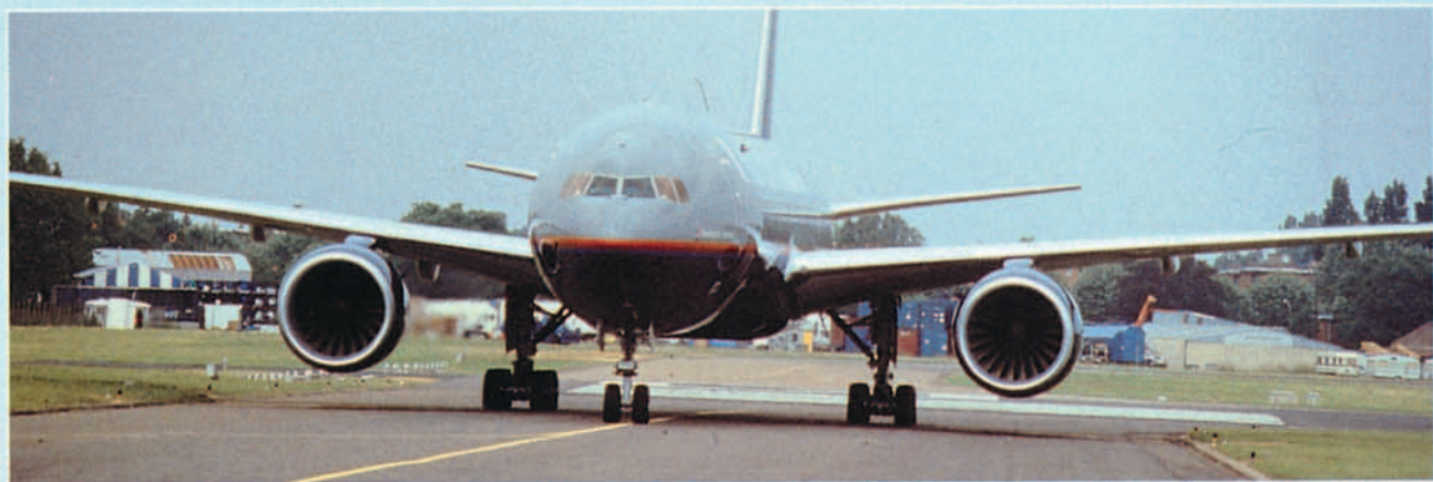
1995 fue el año en que el Boeing 777 entró en servicio.

en su poder, otra, donde hay coincidencia de Boeing y Airbus Industrie, que no se volverá a producir otra oleada de pedidos como la registrada a finales de la década de los 80, ninguna de las cuales resulta precisamente una sorpresa.