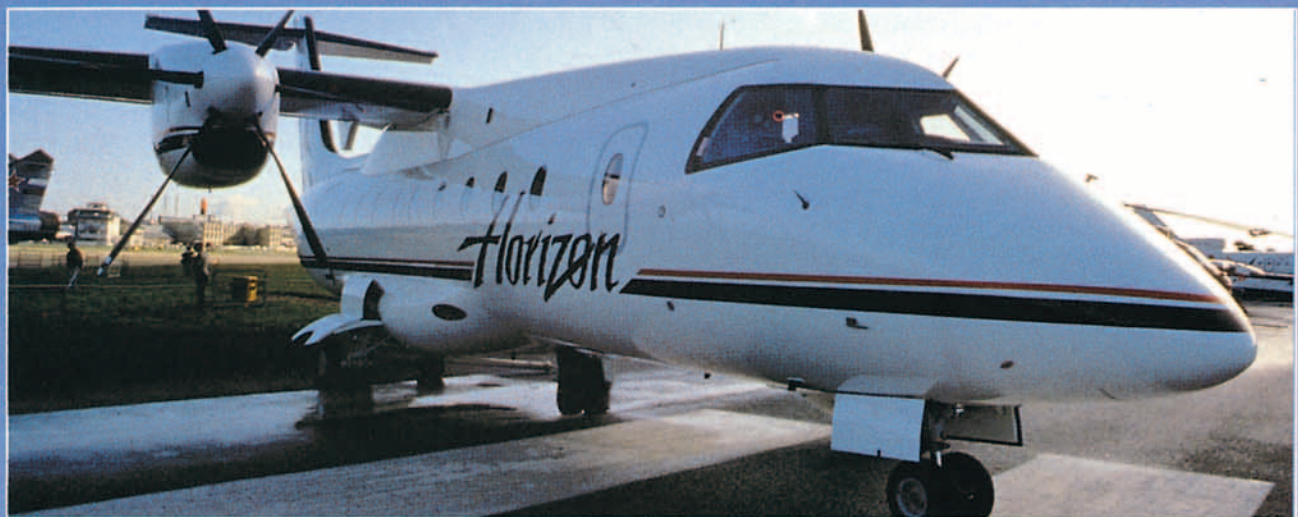
Continuó durante 1995 el imparable progreso de la aviación regional.

acuerdo con la UE no es la panacea universal, sino tan sólo el primer paso del dificultoso camino que debe conducir al saneamiento de Iberia y que, como tal, deberá ser seguido por otros pasos, algunos delicados, muchos dependientes de la evolución del Transporte Aéreo internacional y los más ligados estrechamente a una gestión eficaz.