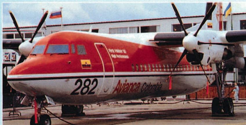
Fokker vio un año más de pérdidas y la adopción de nuevas medidas de supervivencia.

Con esa circunstancia de por medio, el interés por las previsiones en su edición de 1995, se centraba en su significado intrínseco como esperanzas de mercado futuro para los respectivos productos de sus patrocinadores, más por supuesto que en su valor como predicción del devenir de la Aviación Comercial. Utilizando ese razonable filtro, las conclusiones son dos, una que Airbus Industrie continúa convencida de que a finales de siglo un 50% del mercado de los aviones comerciales estará