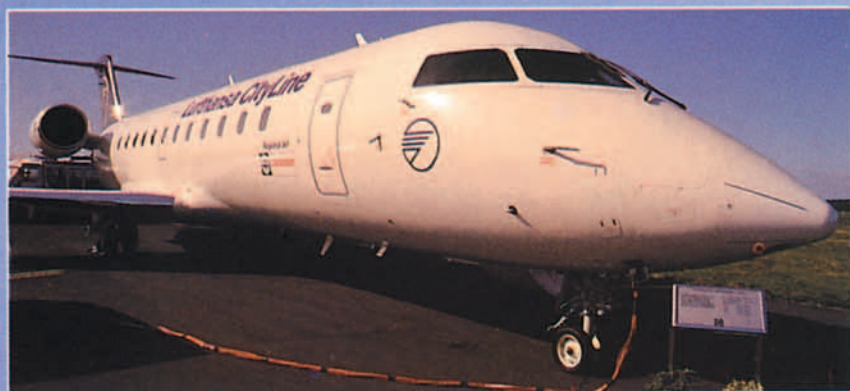
Lufthansa optó el 6 de diciembre por una flota de Lufthansa CityLine equipada exclusivamente con aviones de reacción.

hayan quedado ni mucho menos claras. No se trata sólo de cuestiones irrelevantes, como es el hecho de que la oposición oficial británica a la decisión de la UE, se haya achacado por algún medio al contencioso de Gibraltar, cuando sabido es que esa misma posición se ha sostenido, sin ir más lejos, en el caso de Air France. El problema residiría en que el grueso de la opinión pública no haya alcanzado a saber cuál es la realidad de la situación, que se resume en dos puntos. Uno es que el