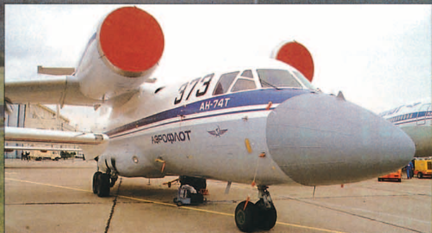
Un diciembre negro resucitó las inquietudes sobre la seguridad aérea en los países de la CEI.

Airbus Industrie decidió al fin producir el A330-200.