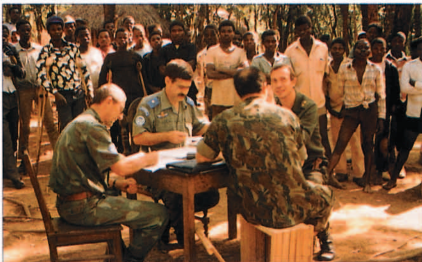
Observadores de distintos países realizando las listas de registro para acantonar a los soldados.

Para el desarrollo de la misión ONUMAZ, Mozambique se ha dividido en tres