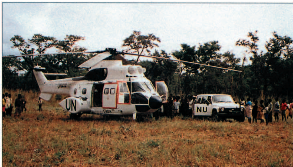
Una vez a la semana llega la provisión de comida, equipos, necesidades y sobre todo el correo de la familia.