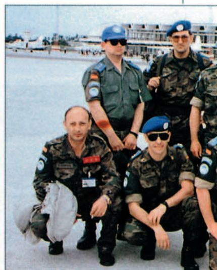
Oficiales de Tierra, Infantería de Marina y Aire

grandes regiones, sur, centro y norte, cada una con sus respectivos cuarteles generales regionales, y un cuartel general nacional ubicado en la capital, Maputo. En cada una de estas regiones se han establecido diversas "assembly areas" (zonas de acantonamiento), unas pertenecientes al FRELIMO o partido del gobierno, que normalmente están ubicadas en los cuarteles y bases de las ciudades, y otras pertenecientes a RENAMO del partido de la guerrilla u oposición al gobierno, situadas en medio del "mato".