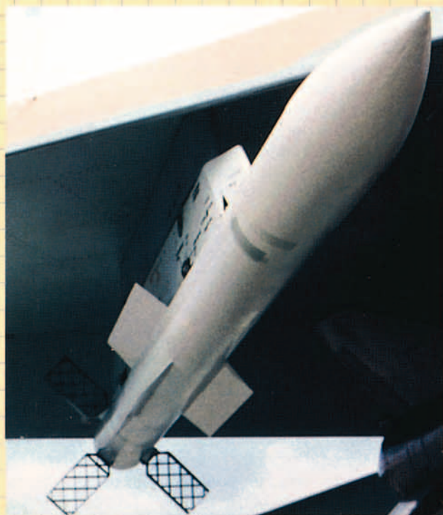
Sobre estas líneas el misil R-72 IR (AA-10B Alamo); a la izquierda un primer plano de la versión rusa del AMRAAM estadounidense, a pesar de la configuración original de sus aletas posteriores, su denominación AMRAAMsky no deja lugar a dudas.

la de proyectos de largo alcance. Para muestra un botón: el R-37 ruso tiene un alcance declarado de 400 Km. Evidentemente la propulsión es sólo uno de los problemas a que se enfrenta este tipo de misiles: identificación, detección y seguimiento por ejemplo no parecen problemas menores a esas distancias. La propulsión basada en cohete-estatorreactor parece la solución más lógica en este tipo de misiles y en ese camino están algunos de los nuevos proyectos de misiles de largo alcance.