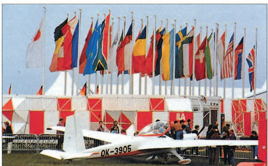
Treinta países de la Europa del Este y el Oeste se dieron cita este año en Berlín

después de 84 años de letargo en favor de la ciudad de Hannover. Vuelve a sus orígenes con un gran impulso institucional pero rodeado de problemas: crisis económica,