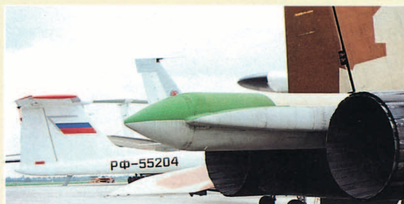
SUKHOI 30 Y 35 LAS VEDETTES DEL SALON

Ataviados con originales camuflajes, los dos nuevos proyectos del gabinete Sukhoi sobre su diseño original Su-27 "Flanker" hacían su aparición por primera vez en Occidente. Una cabina moderna con tres pantallas CRT, canards y mandos de vuelo eléctricos que le permiten volar la maniobra "Cobra" no sólo en el plano vertical sino horizontal, son los detalles mejor conocidos de estos aviones. En el terreno de la especulación quedan, su nuevo radar, el sensor de infrarrojos,IRST y el misterioso aguijón que emerge de entre sus dos nuevos motores al que los expertos atribuyen, un radar con cobertura del sector trasero, capaz de asignar y guiar misiles a blancos en este sector. Si esto fuera así, habría que someter a una profunda revisión las actuales reglas del combate aéreo.