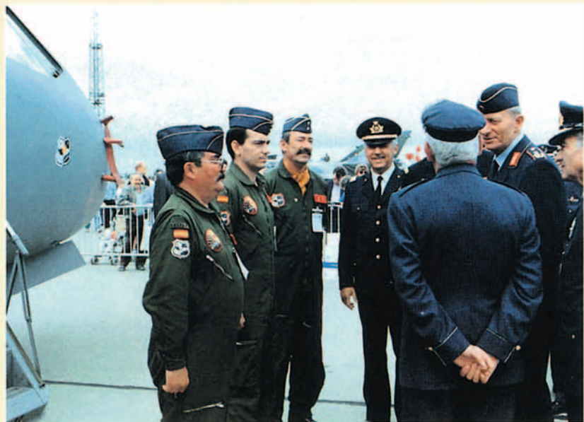
El Ala-35 en representación del Ejército del Aire expuso uno de sus últimos CN-235 recepcionados en Getafe, la tripulación saluda a los Jefes de Estado Mayor.

El Salón de Berlín puede que encuentre su espacio económico dentro de la competencia y la crisis que afectan a una Europa que parece pequeña para rentabilizar dos Salones