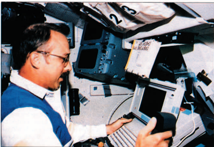
Pruebas con interfaces de fibra óptica a bordo del Atlantis para enlazar subsistemas digitales y de video entre la bodega de carga y el compartimento de la tripulación.

El tipo de teclado utilizado se compone sólo de 32 botones, todos ellos del mismo tamaño, y dispuestos en cuatro columnas de ocho. Algunos de ellos llevan rótulos de funciones, como por ejemplo las teclas FAULT SUMM, SYS SUMM, MSG RESET, ACK, GPC CRT, IO RESET, ITEM, EXEC,