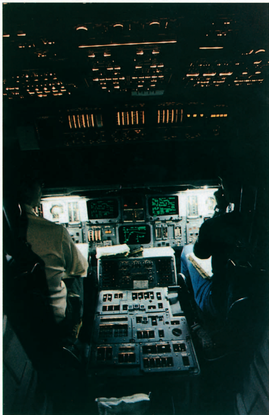
Imagen de la cabina de mando del Shuttle en las que se aprecian tres monitores del sistema informático, y justo debajo un panel con dos teclados.