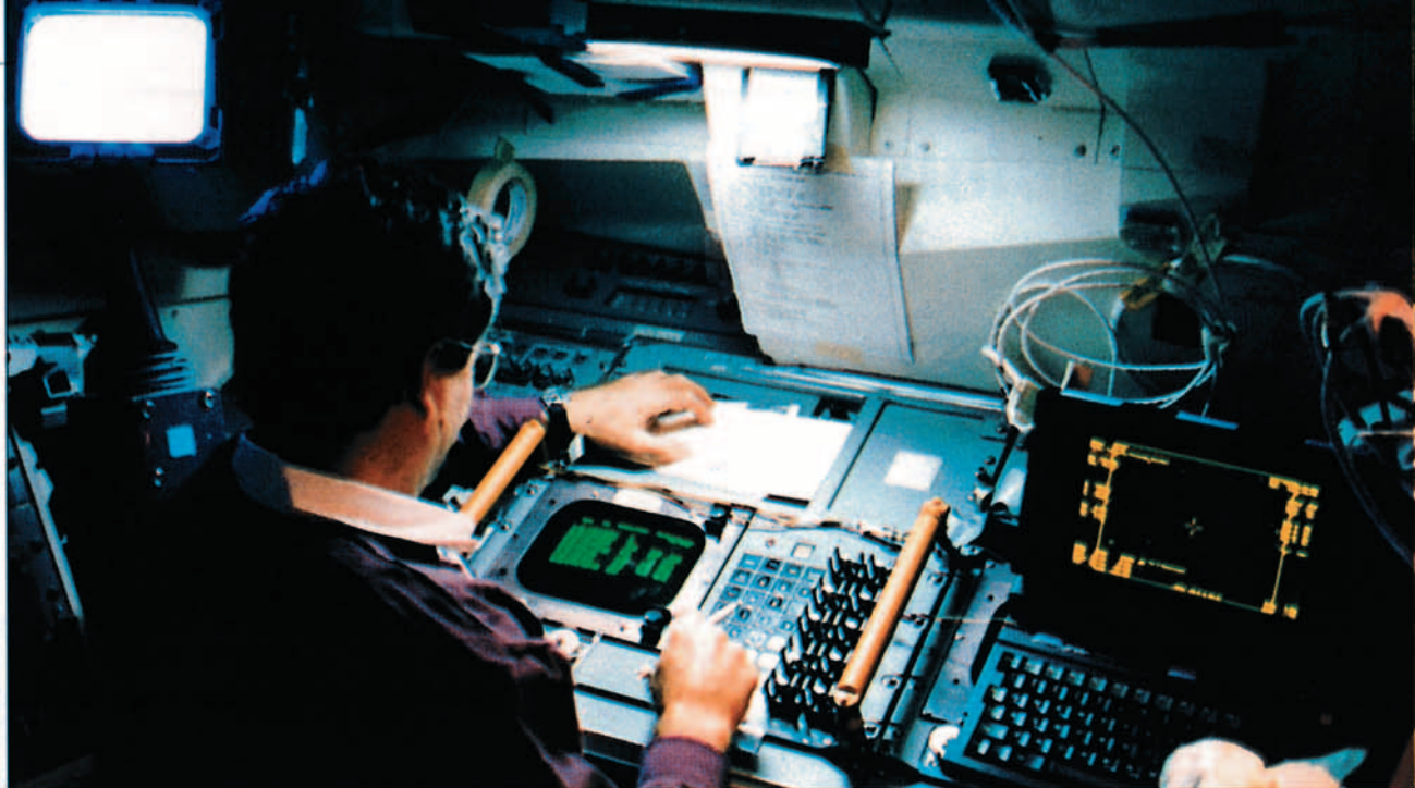
El astronauta Charles L. Veach trabajando con ordenadores a bordo del transbordador Discovery durante una misión dedicada al Departamento de Defensa.