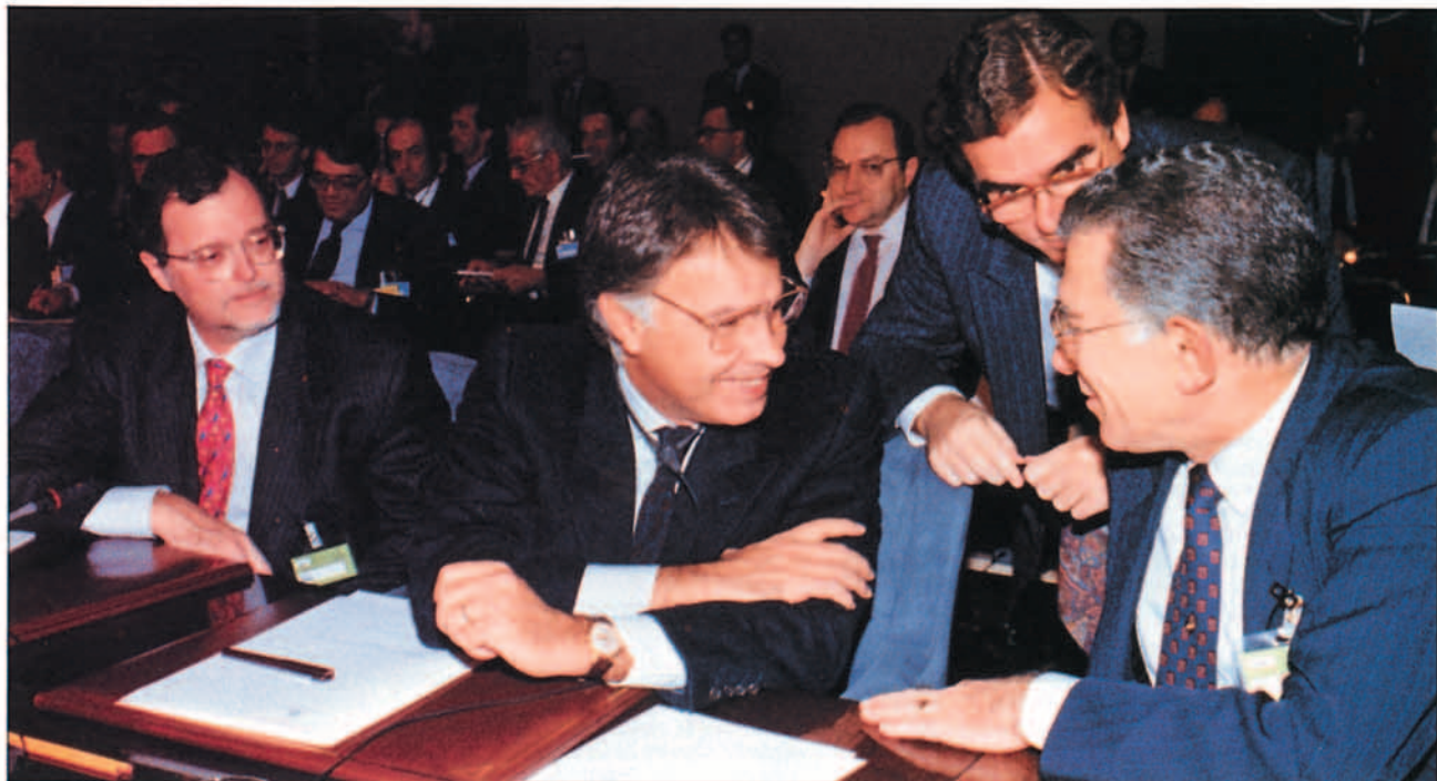
Reunión del Consejo del Atlántico Norte donde los Jefes de Estado y Jefes de Gobierno aprobaron el nuevo "Concepto Estratégico". (Roma, Noviembre de 1991).

La idea de creación de un E.M. no integrado en la estructura de SHAPE se consideró inicialmente inadecuada debido a las dificultades que tal separación implicaría, en relación con la coordinación de los trabajos a realizar en áreas de gestión con muchos "puntos de contacto", a las exigencias de apoyo administrativo adicional que requeriría y también