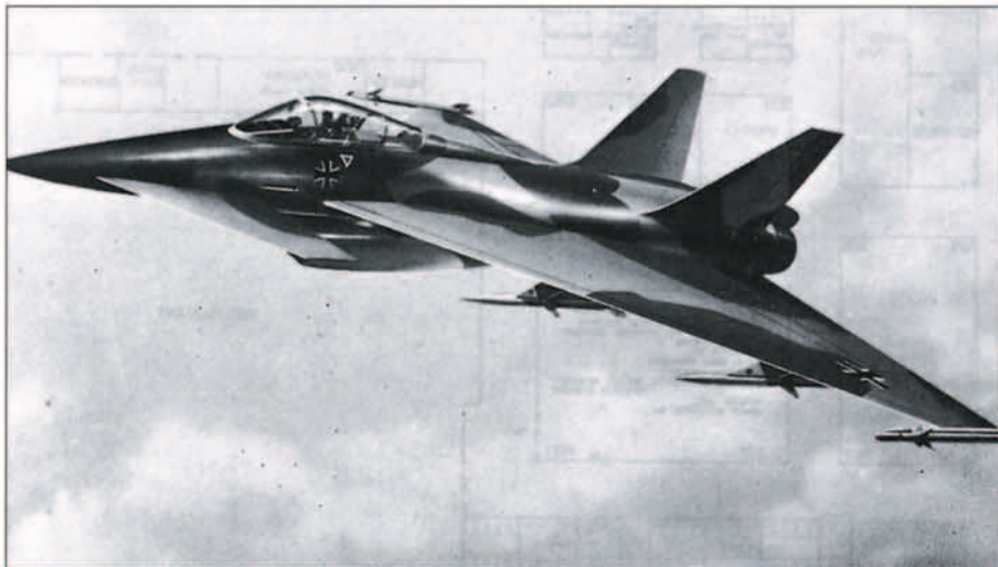
El concepto TKF-90 de MBB según un dibujo distribuido a la prensa en la edición de 1980 del Salón de Hannover.

dos por MBB era muy clara. A través de sus múltiples estudios, había concluido que las maniobras a baja velocidad consideradas sólo serían posibles en aeronaves no VTOL decelerando a base de aumentar su ángulo de ataque por encima de los 70°, y para conseguir el control en esas circunstancias de postpérdida no habría más camino que deflectar el chorro de los motores en la dirección adecuada y ayudarse de unos eficaces canards debidamente acoplados con los restantes mandos. Que la toma del motor debería comportarse sin problemas en esas condiciones es más que evidente.