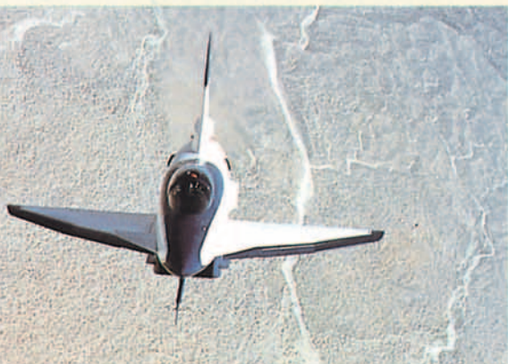
La posición de la pértiga hubo de ser cuidadosamente estudiada para evitar la producción de perturbaciones en la maniobra de ambos X-31A.

29 de abril de 1993: El X-31A/2 pilotado por Karl Lang lleva a efecto por vez primera un cambio de rumbo de 180° en condiciones de postpérdida luego de haber alcanzado un ángulo de ataque de 74°, merced a la maniobra Herbst . El radio de giro fue de 475 pies (145 m.), se invirtió en la operación un tiempo de sólo 9 segundos y la altura fue de 19.400 pies (5.900 m.).