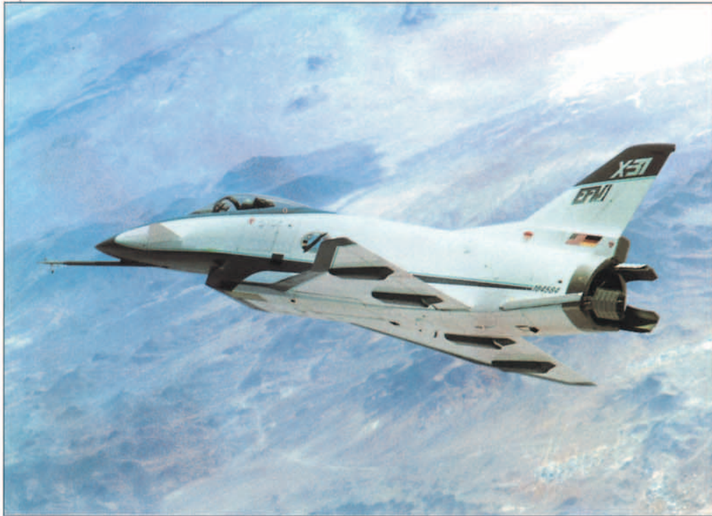
El X-31A/1 en vuelo sobre Edwards. Observe la aleta situada en el fuselaje delante de la tobera, añadida junto con otra simétrica al lado opuesto para corregir un problema de encabritamiento detectado cuando se comenzaron a alcanzar los 60° de ángulo de ataque. (Rockwell).

El camino abierto por los X-31A ha sido continuado de hecho por el F-16 antes del final de la vida operativa de ambos prototipos. En efecto, el F-16B VISTA ( Variable Stability Inflight Simulator Aircraft ) ha sido utilizado durante 1993 para cumplimentar el programa MATV ( Multi Axis Thrust Vectoring ), consistente en dotarle con