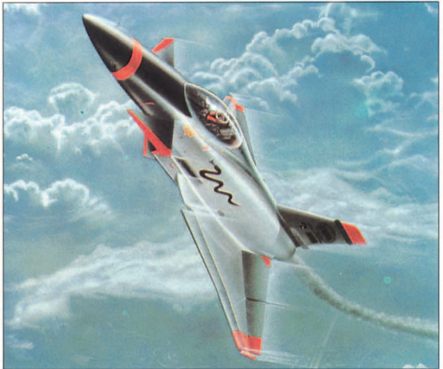
Uno de los conceptos hechos públicos por Rockwell y MBB poco después de la firma del memorándum de acuerdo entre Estados Unidos y la República Federal Alemana para el desarrollo del proyecto EFM/SNAKE. Aunque las líneas generales son próximas a las de los X-31A, no aparecen las aletas deflectoras en el dibujo.

El reparto industrial del programa se constituyó con Rockwell como primera subcontratista, en base a lo cual tuvo plena responsabilidad sobre su desarrollo. La firma estadounidense diseñó, construyó e integró los sistemas, el fuselaje, los canards y la cola vertical, mientras que MBB hizo lo