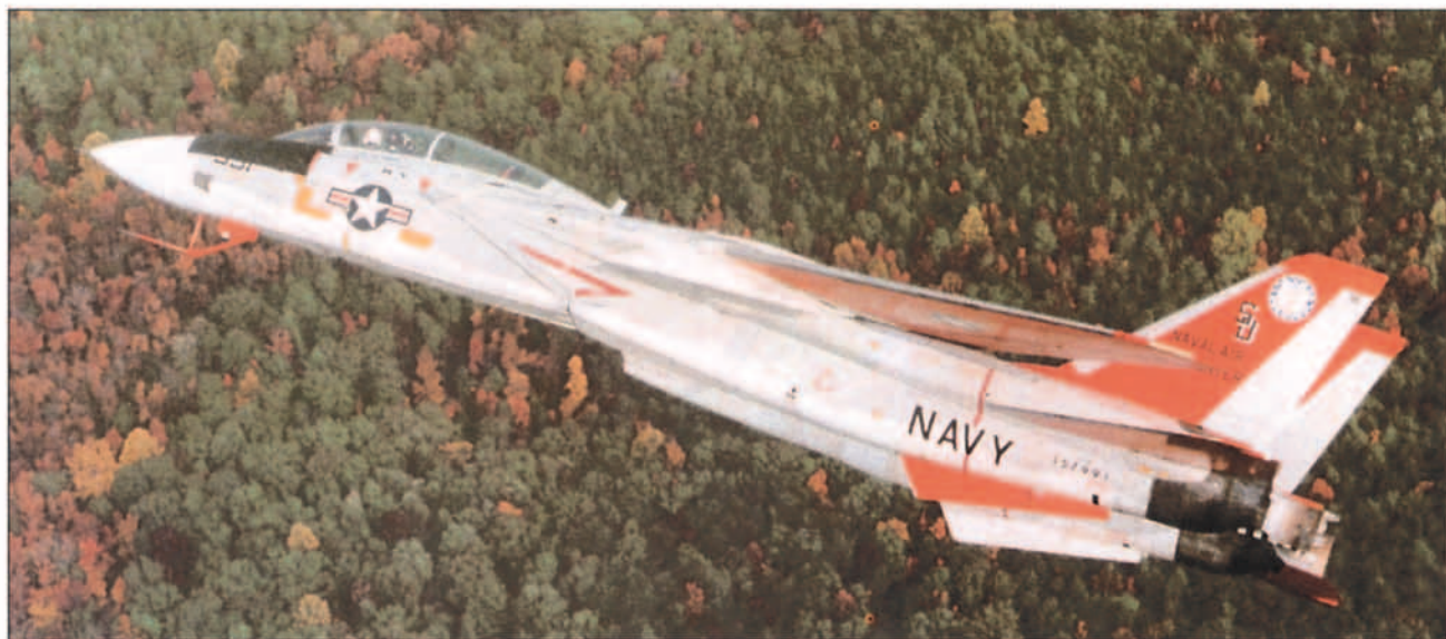
El F-14A spin demonstrator en el curso de un vuelo de pruebas.

Como la cronología adjunta muestra, El F-14 jugó un papel notorio en la existencia de los X-31A. La separación entre los ejes de los motores TF30 del avión de Grumman -aproximadamente 2,7 m.-, hace que en caso de fallo de uno de ellos se produzca una fuerte guiñada. Con vistas a mejorar esa situación el David Taylor Naval Ship Research and Development Center analizó la instalación de aletas deflectoras en ambos motores, configuración que tras múltiples estudios fue volada en el F-14A spin demonstrator en su configuración final; en caso de fallo de uno de los moto-