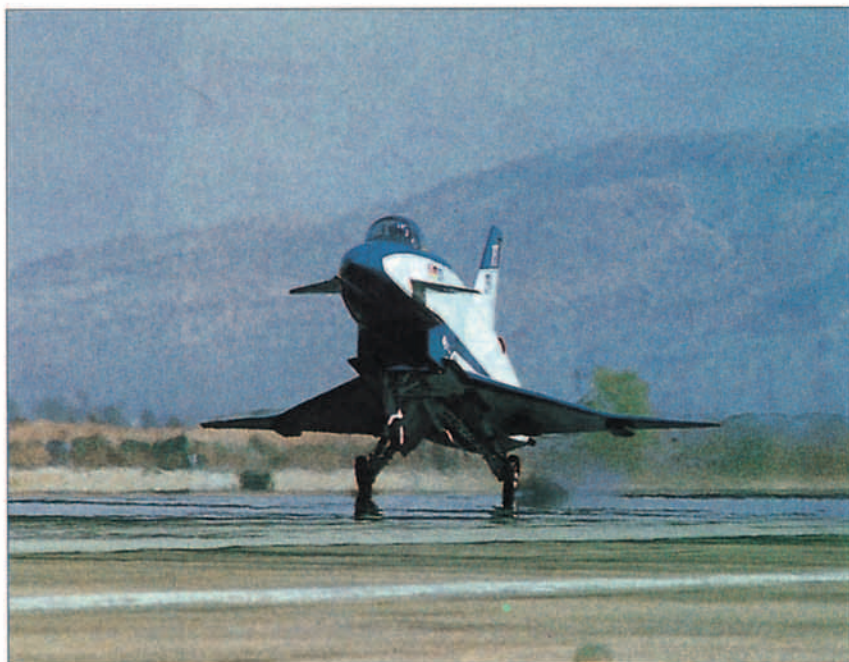
Las velocidades de despegue y aterrizaje de los X-31A son del orden de los 170 nudos (315 km/h). (Rockwell)

La maniobra de diseño del X-31A es conocida como maniobra Herbst , la cual debe su nombre a Wolfgang Herbst, el ingeniero y piloto alemán que la concibió en los días en que Estados Unidos y Alemania decidieron proceder conjuntamente al