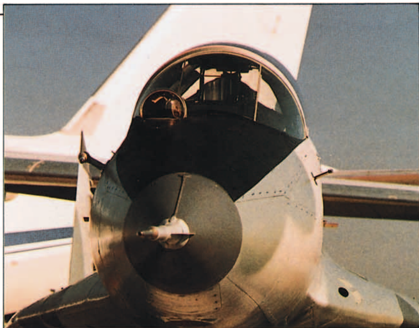
El Mig-29 ha incorporado a su diseño las mejores características de los aviones norteamericanos F-14 y F-15.