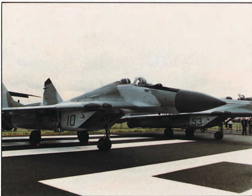
Sus características aerodinámicas le proporcionan una maniobrabilidad extraordinaria.