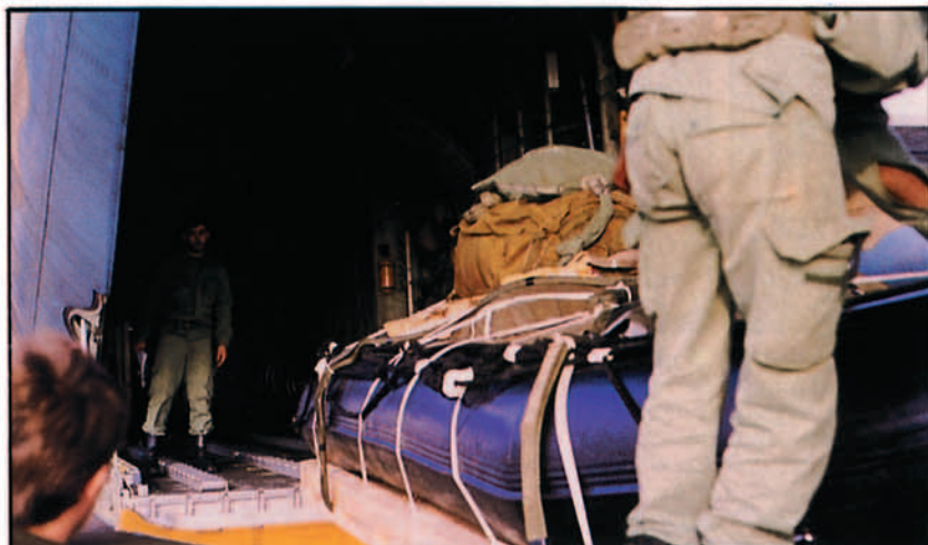
Lanzamiento de la balsa de asalto Zodiac. Operación "Trabuco".

raciones de acomodación con la BRILAT, la Armada, la EZAPAC y la EATAM. Asimismo, se han realizado las estafetas habituales y extraordinarias a Canarias y Francia y entre marzo y diciembre. Un total de 14 estafetas a Namibia y el destacamento de un avión, dos tripulaciones y personal de tierra como contingente UNTAG a este país africano durante 45 días. Un elevado número de misiones a distintos países del mundo en transportes logísticos del MACOM, MAPER, MAMAT, MACAN, MATRA, Casa Real, Fuerzas de Seguridad del Estado y otros organismos nacionales que han hecho que esta destacada y prestigiosa unidad, la más importante del Ejército del Aire en la actualidad, complete en el año finalizado un total de 728 misiones en las que se han volado alrededor de 5.000 horas, transportando 38.000 pasajeros y casi 4 millones y medio de kg. de carga, lanzados alrededor de 10.000 paracaidistas y más de 500 cargas, que han sumado una cantidad de kg. lanzados próxima a los 400.000 y reabastecidos en vuelo alrededor de 280.000 litros de combustible. ¿No es frenética la actividad el Ala 31? Seguiremos trabajando en esta línea.