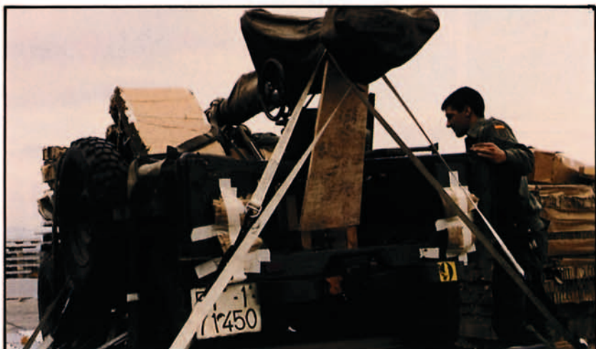
Preparación de un vehículo con cañón sin retroceso. Operación "Cóndor".