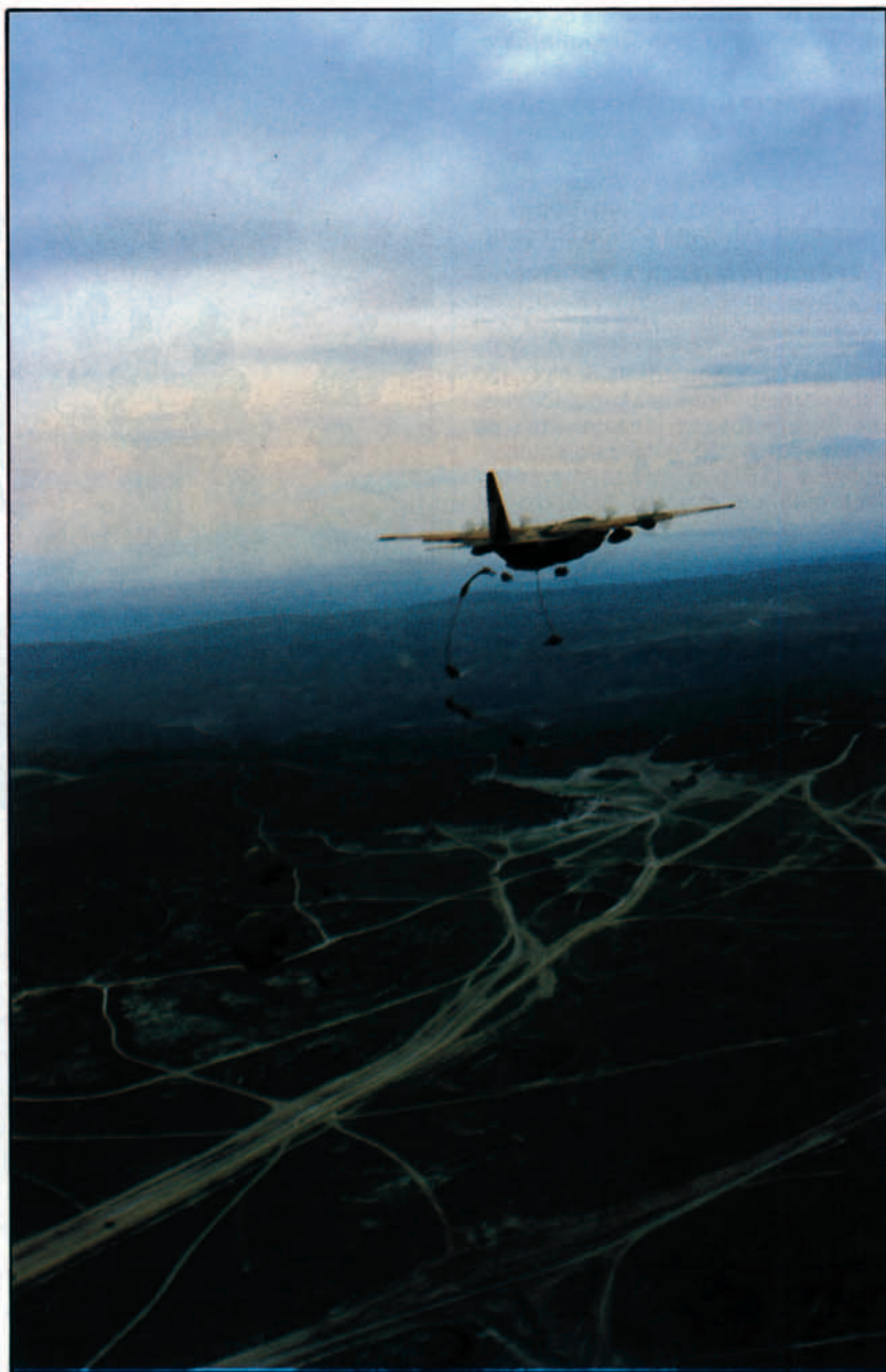
Lanzamiento de personal de la BRIPAC en San Gregorio, Zaragoza. Operación "Condor".

Aunque ya desde primeros de año se llevaba un buen ritmo, con la llegada de la primavera y el mes de abril, se plantea a esta Unidad, ubicada a la vera del Moncayo, una nueva reválida que, como siempre, ha sabido superar, adjudicándose un sobresaliente "cum laude". A las misiones programadas por el Mando con antelación, se fueron añadiendo otras que fueron surgiendo sobre la marcha, en función de distintas necesidades nacionales, humanitarias o de Estado. Así, a los viajes previstos a Namibia a partir de mitad de mes, se añadieron varios de Estado: uno a Chipre, para recoger el cadáver de nuestro Embajador en Beirut, otro para evacuar personal entre Dakar y Nouachok y, varios más, para trasladar terroristas desde Argelia a Santo Domingo, Cabo Verde o Venezuela. Todos