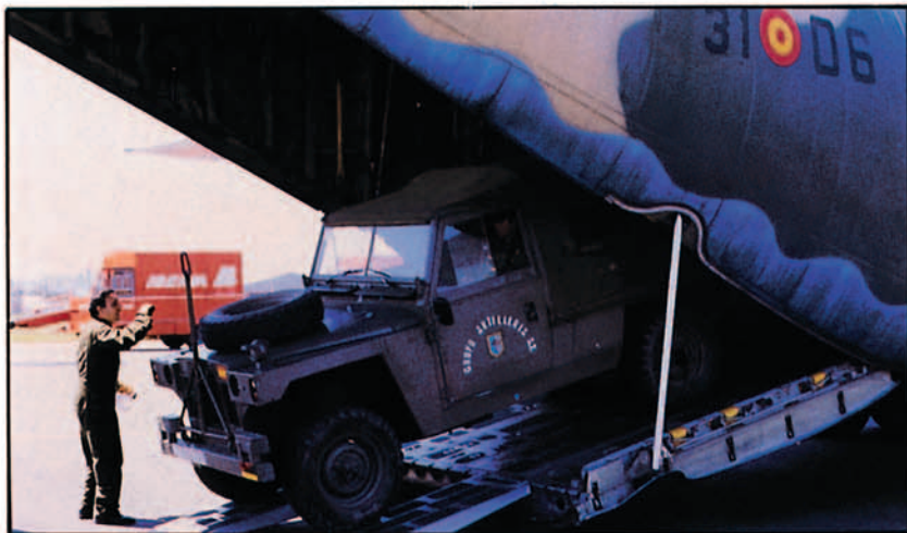
Aerotransporte de la BRILAT. Ejercicio "Avutarda".