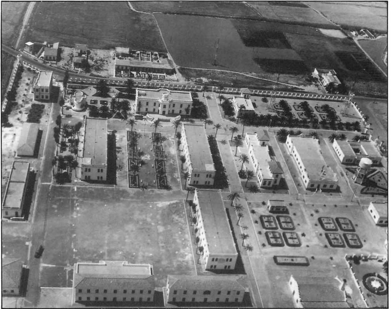
Vista aérea. Este-Oeste, de la Base de Los Alcázares en 1957. Desde la postguerra apenas ha variado su fisonomía.

convertirse en futuros oficiales profesionales de Intendencia del Aire, asimismo pasaron antes de crearse la AGA por los Alcázares quienes ingresaban en los Cuerpos que cumplían un periodo de tres meses de formación militar.