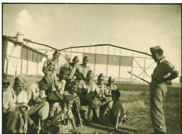
Alféreces Alumnos de la 2.ª Promoción de la AGA, en prácticas de fortificación de 4.º Curso en la Academia del Arma de Tropas de Aviación, Los Alcázares (Murcia).

tes, máxime cuando inicialmente —el primer semestre— realizaban los estudios en la Academia de Aviación de León, compartiéndolos con los compañeros del Arma de Aviación (EA). No obstante, los grupos no fueron similares en número entre sí. El 1.º grupo estaba formado por 90; el 2.º por 29, el 3.º por 6 y el 4.º por 40, según figuran en los respectivos Boletines Oficiales del Aire de nombramiento de tenientes profesionales.