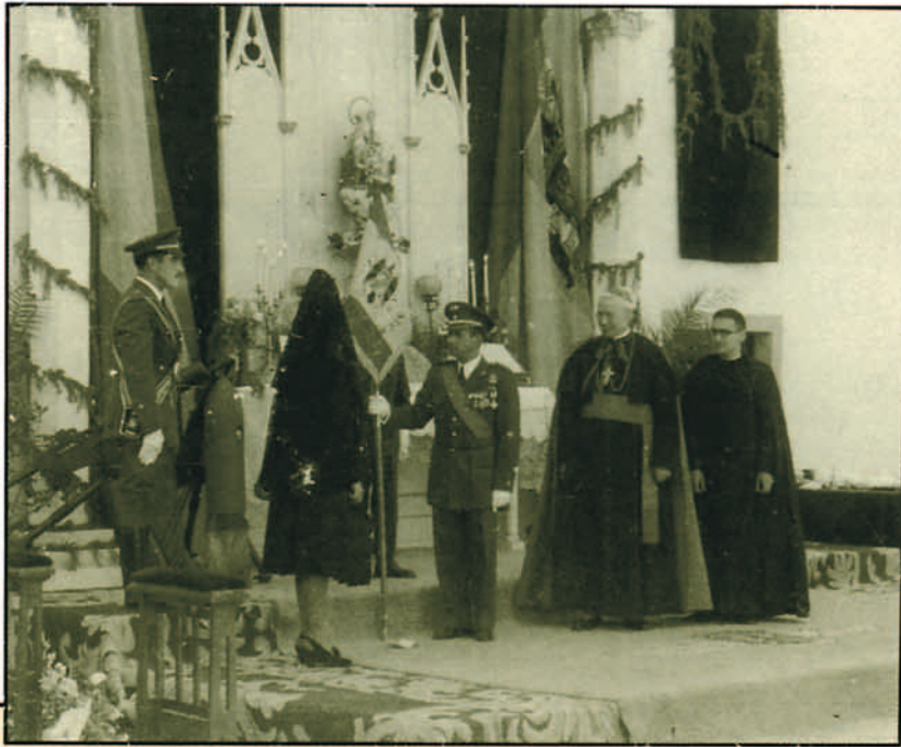
Entrega de Estandarte a la Academia de Tropas de Aviación, Los Alcázares (Murcia), el 14 de julio de 1946.

rico aeródromo-base de hidros de Los Alcázares, a orillas del Mar Menor, cerca de San Javier.