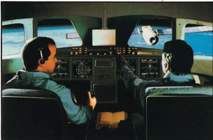
Simulación de una misión Hermes en el espacio.

— Hay dos diferencias. La primera, evidente, es que los soviéticos dan una gran importancia al entrenamiento físico y psicológico, incluso para vuelos de corta duración, porque en su filosofía de en-