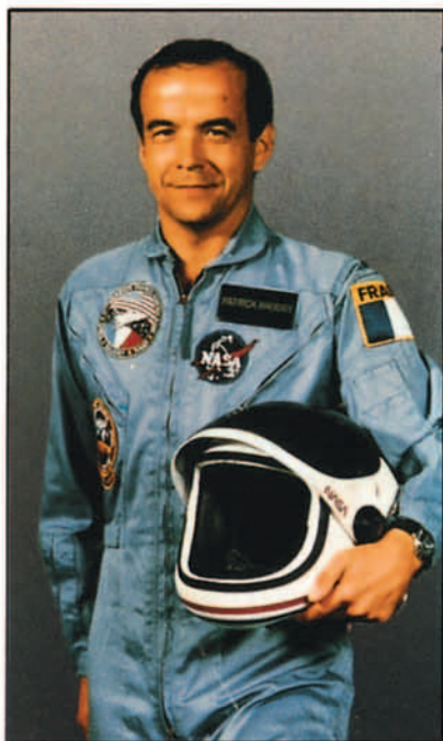
Patrick Baudry con traje de astronauta de la NASA.