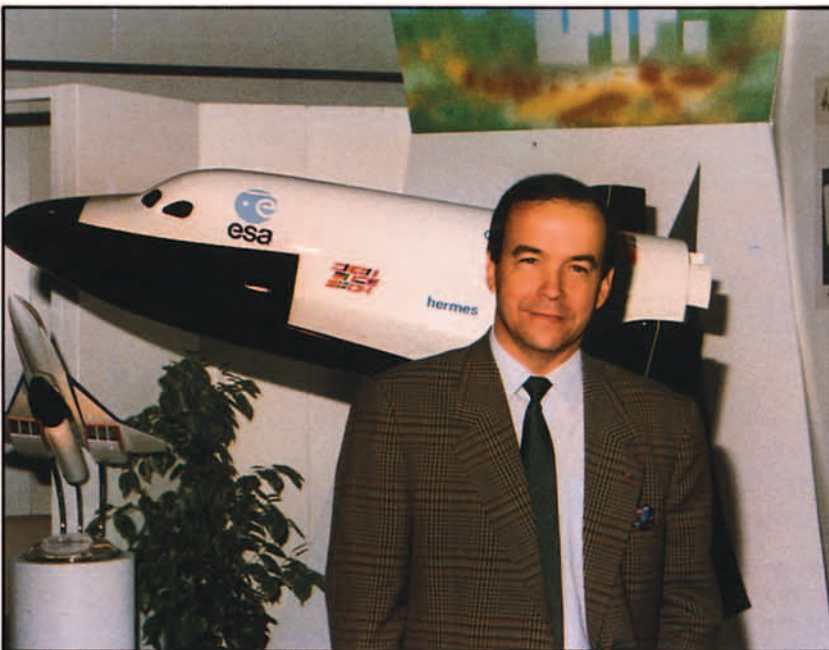
Nuestro entrevistado delante de la maqueta de su dedicación más ambiciosa.

Lo he hecho porque creo que en el conjunto de Europa puede ser un medio de formar y aproximar al público al mundo del espacio huyendo de hacer de esta cuestión una actividad confidencial, reservada a unos pocos. ■