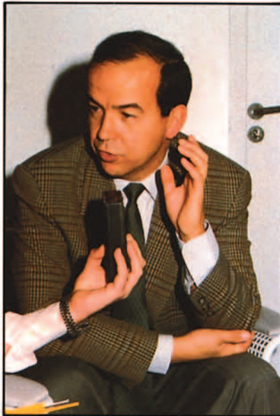
El Consejero para vuelos espaciales de AEROS-PATIALE, durante la entrevista.

— Ahora debo hablar como representante de la Asociación Europea de Astronautas. Nuestra opinión es que la decisión de haber distribuido el Centro entre tantos lugares como se ha hecho, por razones polí-