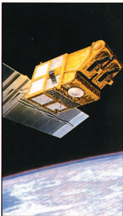
Visión artística de un SPOT 4 (Satélite para observación de la Tierra) que realizado por MATRA space, será lanzado el próximo año desde un cohete Ariane.

— La ESA incluye en la denominación "marcha hacia el espacio" el