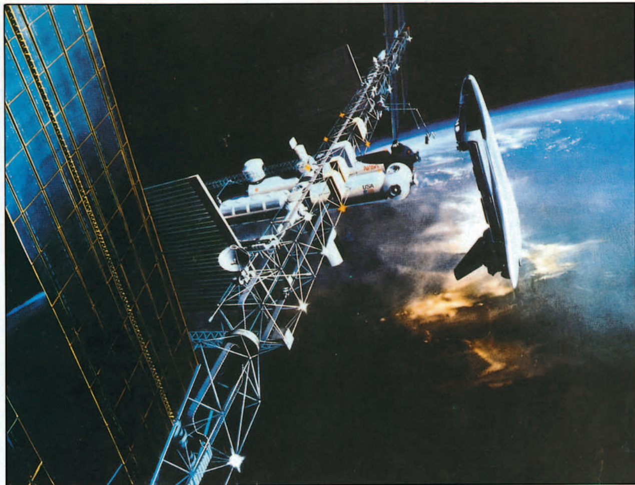
Ilustración artística de la Estación Espacial de la NASA, prevista su operatividad para finales de este siglo. La NASA tiene planificado que para mediados de la década de los 90, lanzaderas americanas comiencen a ser portadoras de componentes para el entramado estructural de la Estación.

Espacial Internacional de la NASA, siendo responsable del entramado estructural.