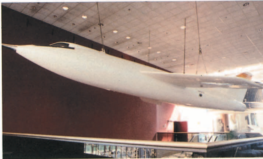
▼ En la sala dedicada a "reconocimiento" podemos contemplar este U 2.