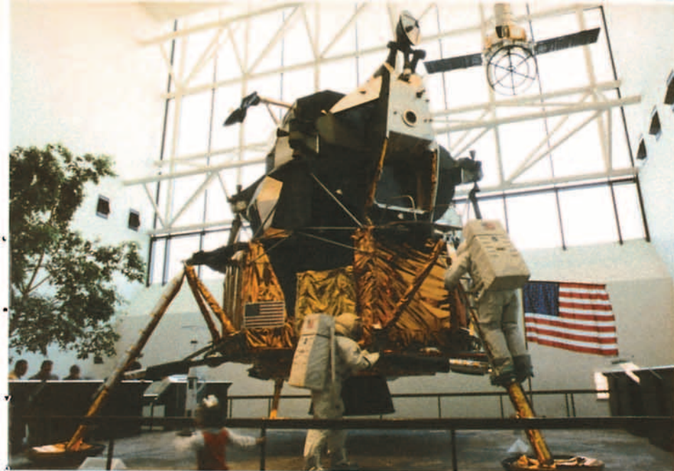
Módulo lunar gemelo al que utilizaron Armstrong y Aldrin en el Apollo 11. Debajo, réplica exacta del Apollo-Soyuz de 1975.