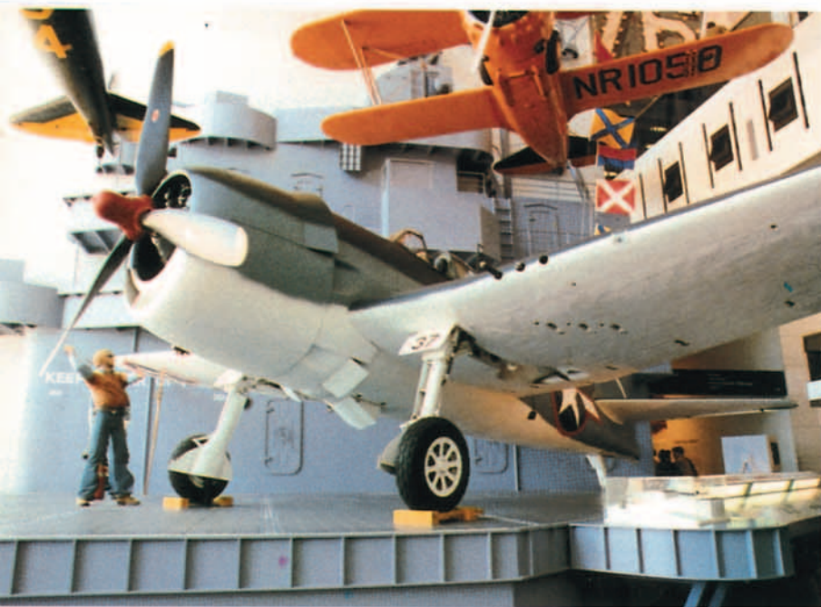
Grumman F-4F Wildcat, dispuesto sobre una cubierta de portaaviones simulada.