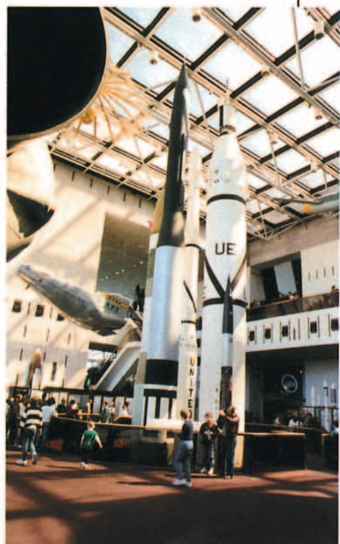
Sala dedicada al espacio. Una V-1 alemana y un M2F2 "Cuerpo sustentador" (izquierda de la fotografía) flanquean a varios cohetes.