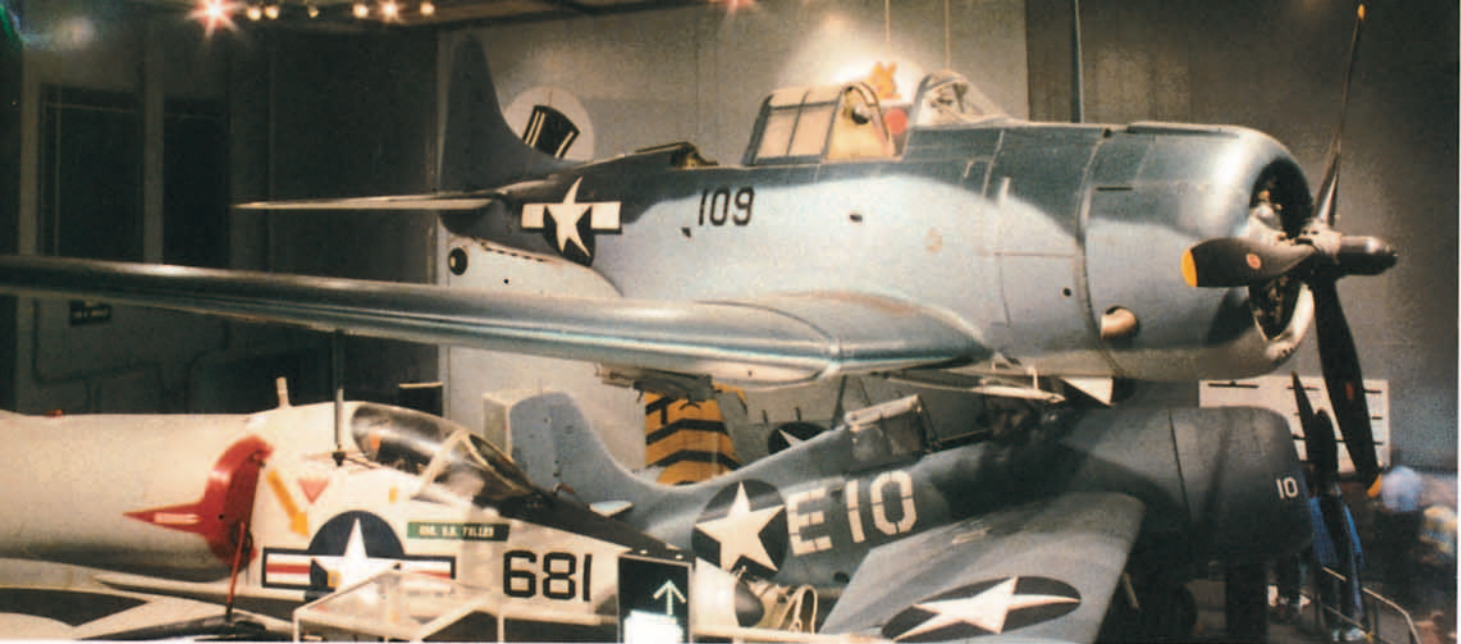
Exposición dedicada a la Aviación Naval: en primer plano un SDB "DAUNTLESS".