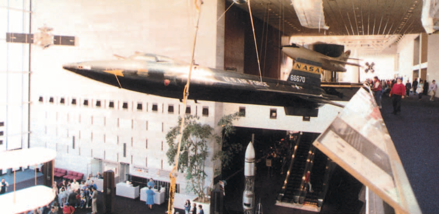
▲ Detrás del X-15 se encuentra el Douglas D-558-II Skyrocket.

Con este Douglas D-558-II Skyrocket batió Scott Crossfield el mach 2 en 1953.