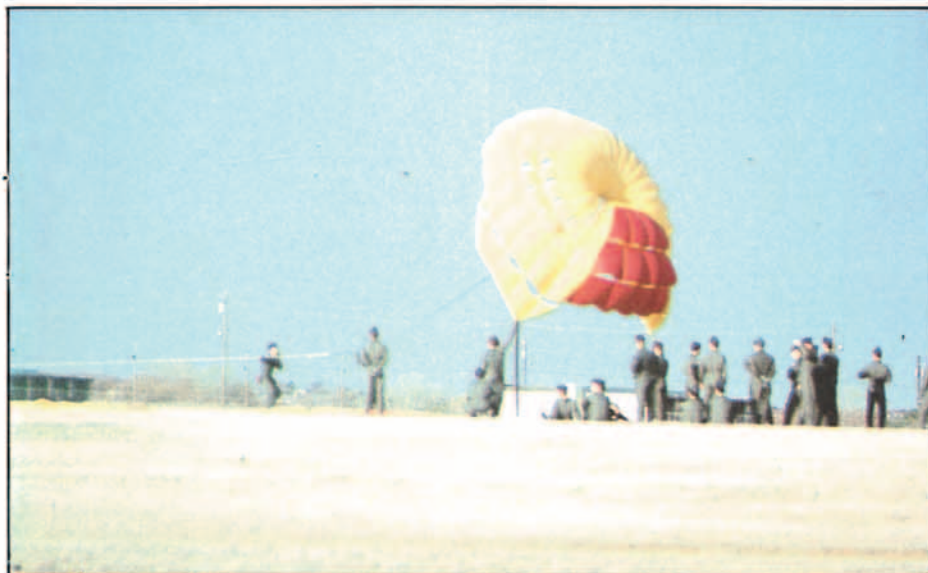
Entrenamiento en el uso del paracaídas.

y la reducción de sus costes. Ya se ha hecho mención a los mismos y no es necesario insistir en ellos.