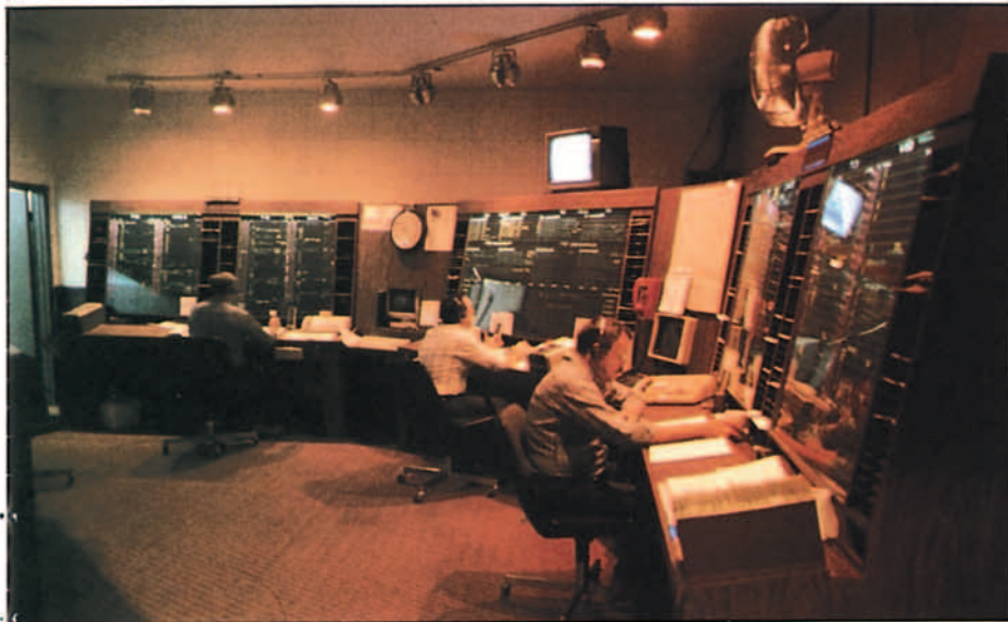
Sala de control de mantenimiento similar a las de las alas españolas.