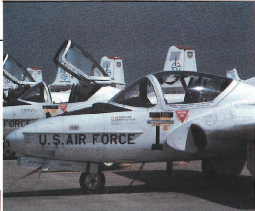
Línea de vuelo del Cessna T-37.

Alianza Atlántica (programa ENJJPT) comenzó a funcionar en Sheppard bajo la estructura del Ala de Entrenamiento de Vuelo número 80 de la Fuerza Aérea de los Estados Unidos, donde continúa en la actualidad tras su extensión hasta 1993.