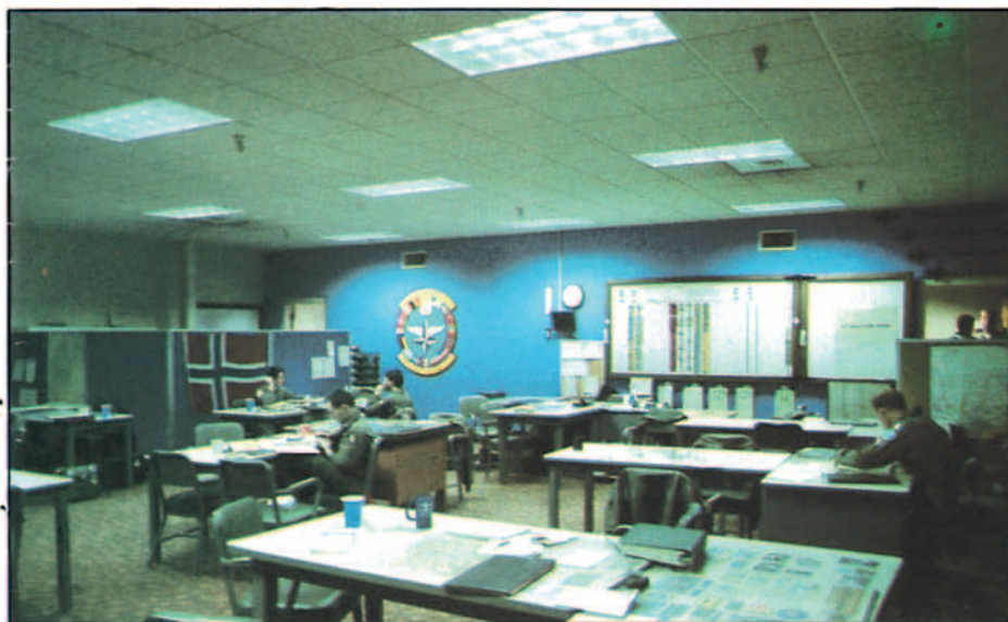
"Territorio noruego", sala similar a la que tiene cada nación participante en el programa.