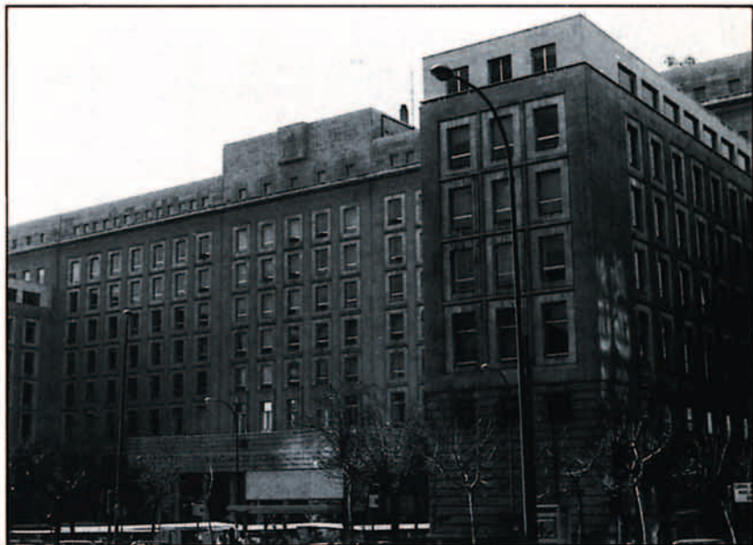
El planteamiento defensivo nacional se ha remodelado para concordarlo con el de los restantes países de la OTAN.

Para el año 1988, las prioridades en política de armamento se sitúan en el área de las telecomunicaciones, guerra electrónica, sistemas de mando y control, sistemas de acústica submarina y detección, y en nuevos materiales. ■