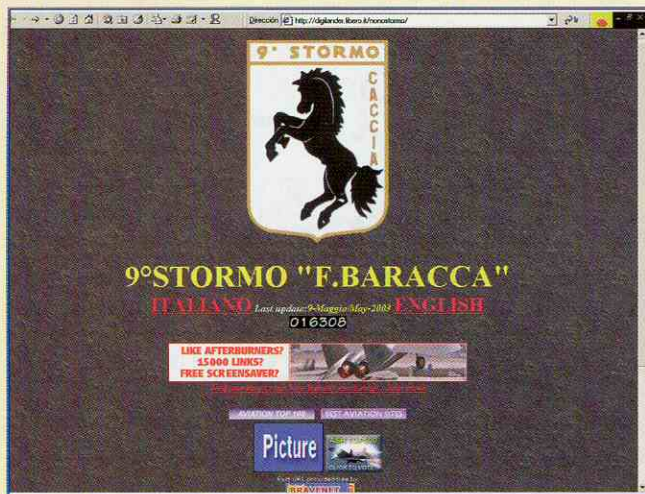
http://digilander.libero.it/nonostormo/ Nono Stormo, unidad dotada de F-104 Starfighter

en sus primeras operaciones militares, inicialmente en Etiopía en 1935, y más tarde en la guerra civil en España entre 1936 y 1939.