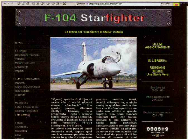
http://digilander.libero.it/air10/f104/ F-104 Starfighter - La storia del "Cacciatore di Stelle" in Italia

Al llegar al poder en 1922, Benito Mussolini quiso que Italia se convirtiera en una potencia mundial. Potenció la industria aeronáutica autóctona y creó la Regia Aeronautica que nació el 23 de marzo de 1923. Durante los años treinta la Regia Aeronautica se vio involucrada