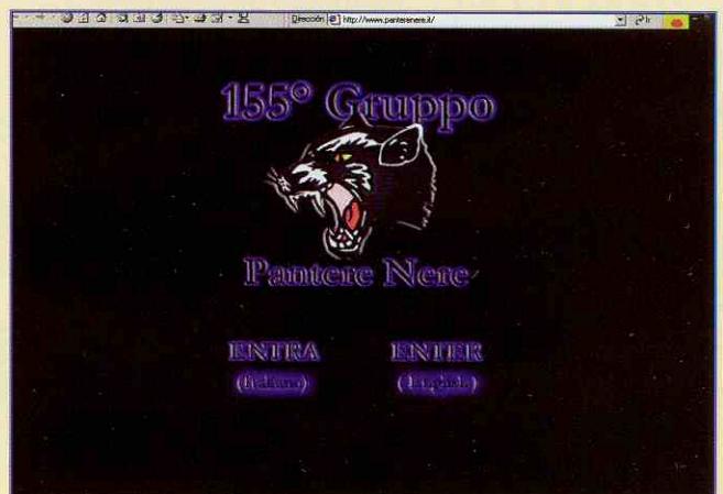
http://www.pantere.it/ 155° Gruppo Pantere Nere