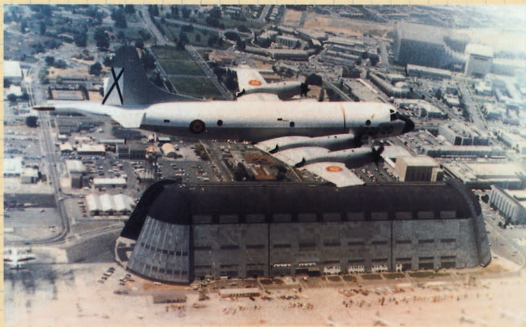
P3A sobrevolando la base de Moffet Field en EE.UU. Se puede observar el hangar de dirigibles.