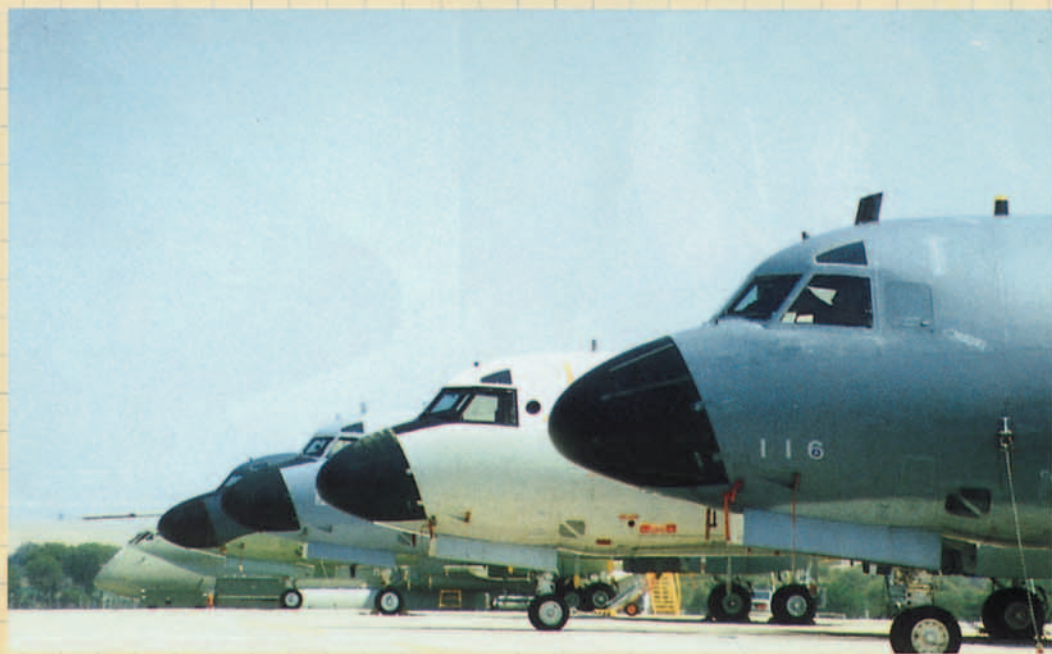
Aviones de Patrulla Marítima en el Ejercicio Tapón 91 en la Base Aérea de Jerez.

A pesar de lo mencionado anteriormente lo que supuso el mayor avance fué su aviónica y los sistemas de navegación y ataque con que fué dotado. Estos avances han ido renovándose hasta nuestros días. Lockheed modificó el interior dotando al avión de los medios más adelantados del momento, que por aquel entonces eran equipos tácticos como los de acústica, AQA-5, con capacidad para poder procesar sonoboyas pasivas así como equipos para analizar la información procedente de sonoboyas activas; radar de búsqueda APS-80 con dos antenas que cubrían 360° y un alcance que podía variar en función de la altura de búsqueda entre 35 NM a 1.500 pies o 160 NM a 10.000 pies; equipos de medidas de apoyo electrónico (ESM) ULA-2, ALD-2B, con los que se podía clasificar una emisión procedente de cualquier radar de exploración, tiro, navegación, etc.; para poder navegar disponía de equipo LORAN, inercial ASN-42, así como sextante utilizando las estrellas para comprobación de posición; en el apartado de comunicaciones contaba con duplicidad de equipos tanto de HF, UHF y VHF, al igual que una completa gama de equipos con los que poder realizar todo tipo de aproximaciones instrumentales VOR, ILS, TACAN, ADF etc.. Como podrá observar el lector si se sitúa a principios de la década de los sesenta, era un avión bastante completo.