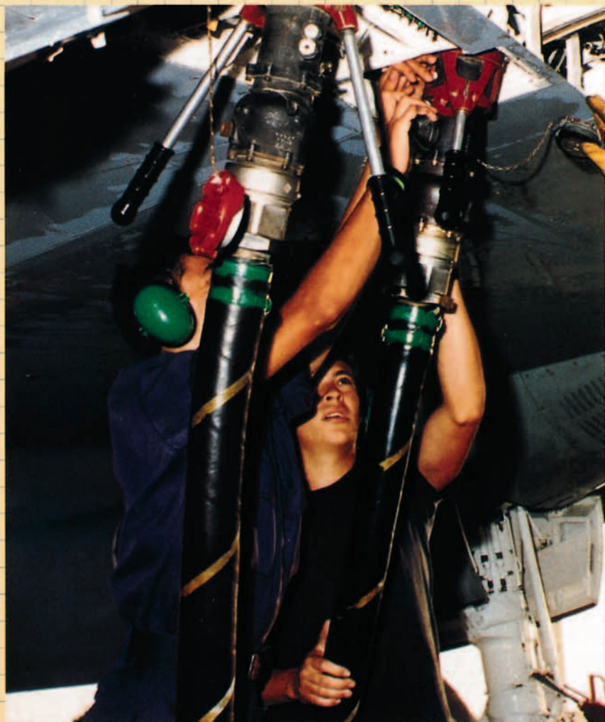
Repstando al Orión. El P-3 puede cargar 60.000 libras de Jp-8.

En el ámbito de los grandes números, el total de aviones ORION construidos ha sido de 650 por