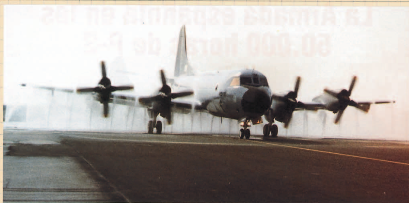
Después de los vuelos a baja cota sobre el mar hay que pasar el el lavadero para quitarse todo el salitre.