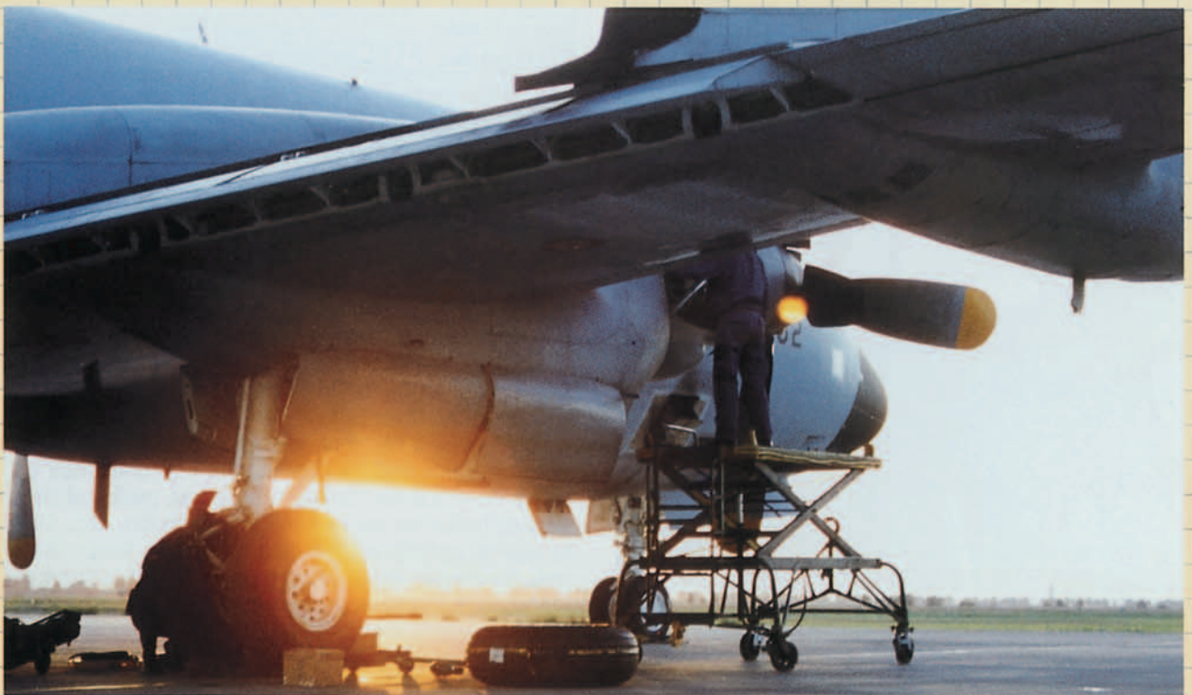
El Escuadrón de Mantenimiento Específico de P3 realiza su callada labor para facilitar el vuelo.

La Fuerza Aérea portuguesa adquirió en el pasado seis aviones P-3B procedentes de Australia los cuales actualizó con un nuevo radar, equipos infrarrojos, acústicos, data-link, y capacidad antisuperficie debido a la integración del misil HARPOON. Igual que los países descritos los equipos tácticos necesitan una actualización y por ello está estudiando un programa que en líneas generales sería muy parecido al del Ejército del Aire.