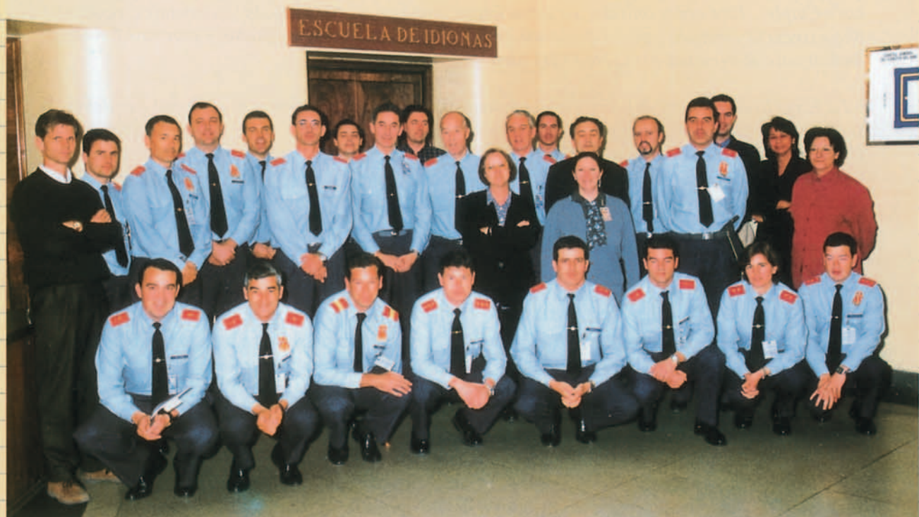
Los asistentes al I Seminario de Departamento de Idiomas con el general DEN y el General Jefe del CEGA.