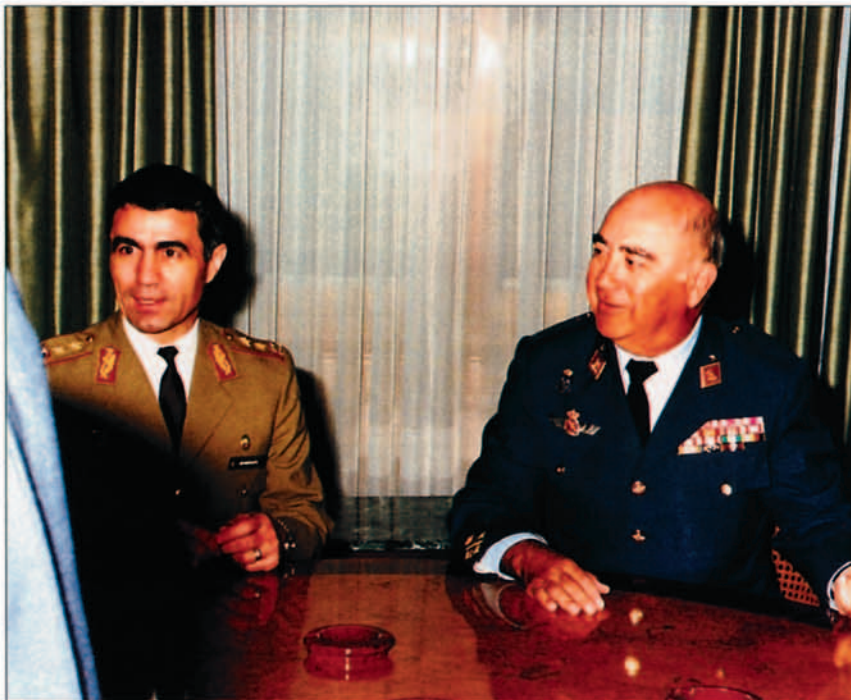
El general del Aire Valderas con el entonces su colega rumano, general Degeratu.

Las nuevas responsabilidades del JEMAD en el cumplimiento de misiones operativas exigen una revisión de la Orden 7/1989, de 3 de febrero, de constitución de la Estructura de Mando Operativo. El Real Decreto 1250/1997, de 24 de julio, por el que se constituye la estructura de Mando Operativo desarrolla lo contemplado en el R.D. 1883/96.