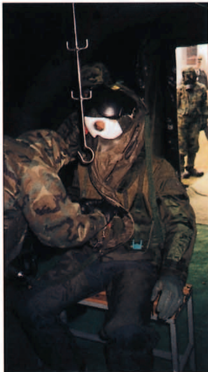
Paso de un piloto inglés por la CCA de la EADA.