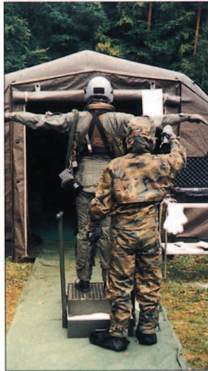
Nivel contaminación previo inicio paso CCA.

otro lado era/es requisito para formar parte de las que ya referidas RF(A). Se impartieron las correspondientes "botas" sobre la defensa NBQ y en especial sobre el equipo de protección y se comenzó a practicar el proceso de equipación y desequipación, paso previo al concepto de CCA (Contaminación Control Aérea).