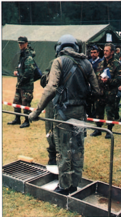
Paso por la CCA belga de un piloto español.