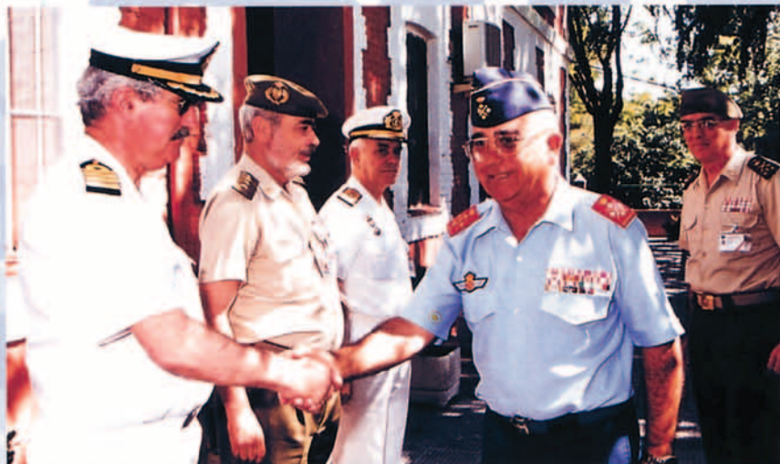
Durante 1999, el JEMAD visitó Retamares en varias ocasiones.

FINAL DEL CONCEPTO ESTRATÉGICO, WASHINGTON 23, 24 DE ABRIL 1999.