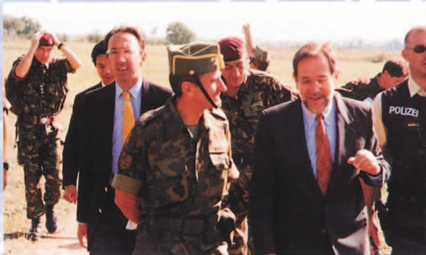
Durante su visita de despedida a Kosovo, los días 26 y 27 de septiembre, el Sr. Solana inspeccionó las tropas españolas encuadradas en KFOR.

La personalidad histórica y cultural de los países de la Europa Occidental y el sentimiento, deseo y voluntad de algunos de ellos de seguir siendo potencias mundiales, ha distorsionado y retrasado el proceso de unión política europea. Las realidades geopolíticas y económicas están haciendo reconsiderar algunas posturas y haciendo recapacitar a los dirigentes europeos. Durante la Cumbre informal de la UE celebrada el 24-25 de octubre de 1998 bajo la presidencia del Reino Unido, el Sr. Blair abrió un debate sobre los aspectos de defensa y seguridad en el futuro de Europa. Ese debate ha seguido en 1999 y como analizaremos más