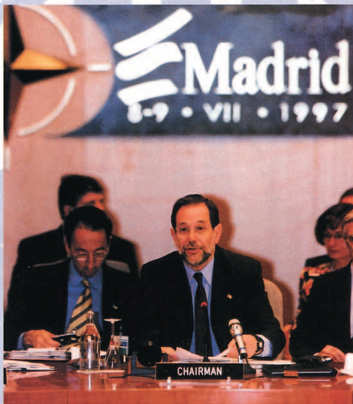
La Cumbre de Madrid marcó el comienzo de una nueva era para la OTAN.

realizó y también por la seriedad y profundidad de los documentos emitidos. Las reuniones de Washington y la campaña aérea sobre Kosovo pasarán a la historia de la OTAN en un año que por esas y por otras causas se puede considerar muy especial.