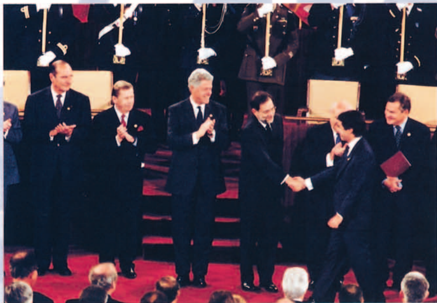
El presidente del Gobierno, Sr. Aznar, saluda al secretario general de la OTAN. Washington, 23 de abril de 1999.