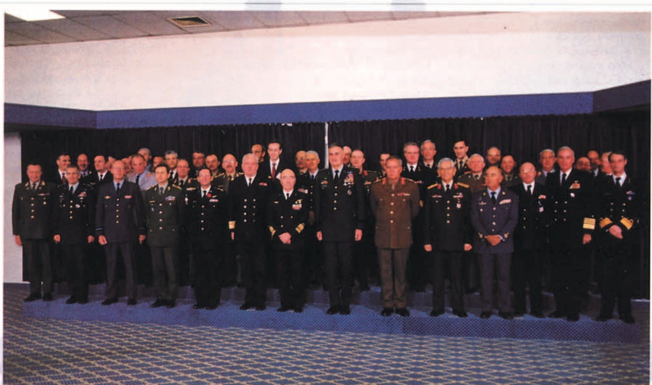
Reunión del Comité Militar en sesión de jefes de Estado Mayor de la Defensa el 9 de noviembre de 1999.

bución de España a la seguridad colectiva y a la defensa de los principios básicos y de los objetivos de la Alianza. En otro párrafo de su declaración el Dr. Solana indicaba que se hacía cargo del puesto cuando la Alianza encaraba uno de los más grandes retos de su historia: la implantación de un plan de paz para acabar con la terrible guerra que ha devastado la antigua Yugoslavia. Terminaba sus palabras el entonces recién nombrado Secretario General, expresando su ilusión por comenzar, con el apoyo del Secretariado y del Estado Mayor Internacional, su trabajo con los 16 miembros de la Alianza en unos tiempos de retos difíciles pero también de grandes oportunidades.