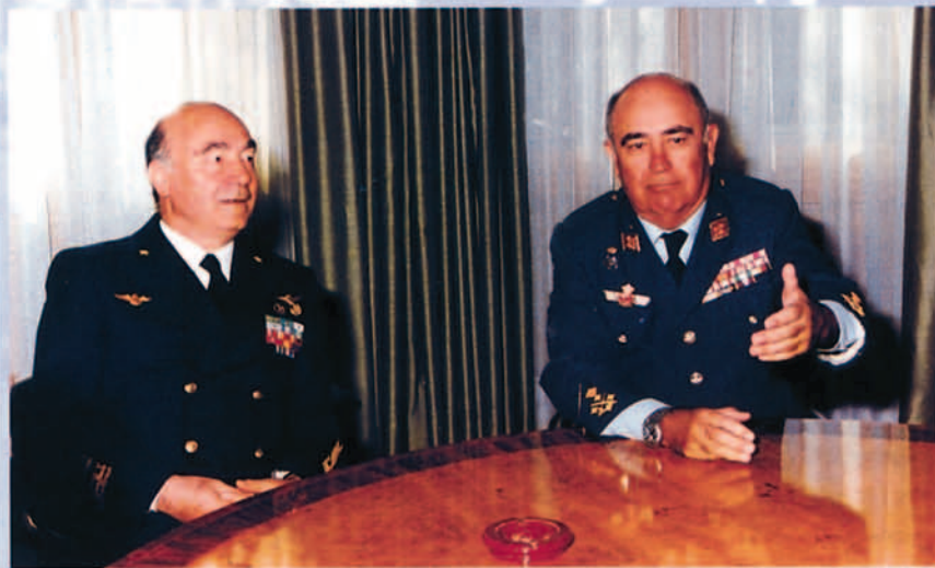
El general del Aire Valderas recibió al nuevo presidente del Comité Militar, almirante Venturoni, con ocasión de su visita oficial a España.

Las posibles dudas que pudiesen existir en el pasado sobre la capacidad de actuar de la OTAN, han quedado disipadas tras las últimas operaciones en los Balcanes. Durante los años de la Guerra Fría, la maquinaria militar de la Alianza se encontraba en un alto estado de disponibilidad y alistamiento, pero salvo en ejercicios más o menos complejos, esa disponibilidad no tuvo que ser contrastada en una operación real. Desde siempre la base de toda la doctrina militar de la Alianza ha sido la disuasión. Para contrarrestar una agresión que no se detuviese ante el potencial aliado se contemplaban como principios de la doctrina aliada: la defensiva a ultranza, la respuesta flexible, la defensa adelantada, el refuerzo rápido de Europa y la participación solidaria en riesgos, cargas y responsabilidades. Aunque algunos de estos principios siguen estando vigentes, la compleja y cambiante realidad estratégica ha obligado a la OTAN a enunciar dos conceptos estratégicos sólo separados por nueve años: el de Roma en 1991 y el de Washington en 1999. La campaña de Kosovo ha demostrado la capacidad de la Alianza para enfrentarse a situaciones complejas y su determinación para actuar cuando se considera necesario. En años anteriores ya se había usado decisión y coraje en los Balcanes, pero ha sido la actuación en Kosovo la que ha dejado claro que, cuando se alcanza el consenso, existe