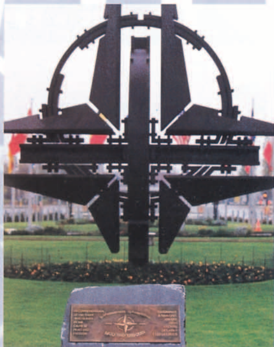
Debajo del emblema de la OTAN, el monumento conmemorativo del 50º aniversario en el Cuartel General de la Alianza en Bruselas.

El futuro del modelo de seguridad en Europa se va a diseñar en los próximos meses. La OTAN sigue ofreciendo la garantía de una alianza madura y renovada, la UEO parece llamada a una reorientación y en la UE ya se habla de la definición de la Política Europea Común de Seguridad y Defensa. Será necesaria una gran prudencia para que, sin perder los logros alcanzados, la arquitectura de seguridad en Europa se acomode a las realidades del nuevo entorno político y estratégico. En las instituciones y órganos de decisión europeos hay españoles en puestos relevantes. Por ello y por la contribución decidida de España y sus Fuerzas Armadas a la seguridad y estabilidad en el Viejo Continente, nuestra Patria se encuentra en inmejorables condiciones para influir positivamente en el proceso iniciado. ■