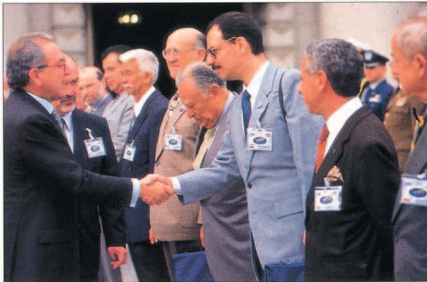
Saludo del ministro de Defensa a los jefes de delegaciones.

Témpore de la Novena Cumbre Iberoamericana de jefes de Estado y de Gobierno, a celebrar en el presente mes de noviembre en La Habana (Cuba), ha aceptado la inclusión del V Congreso Internacional de Historia Aeronáutica y Espacial en el calendario de los foros, seminarios y otras iniciativas celebradas en el marco de la Cumbre en calidad de Comité sectorial, noticia que llegó apenas dos días antes del inicio a