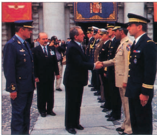
El ministro de Defensa saluda a los agregados militares iberoamericanos, entre los que se encontraba el representante de Chile.

La Declaración de Madrid, suscrita por los jefes de las delegaciones nacionales asistentes al Quinto Congreso (Argentina, Bolivia, Brasil, Colombia, Cuba, Ecuador, España, México, Panamá, Paraguay, Perú, Portugal, República Dominicana, Uruguay y Venezuela, todos ellos miembros de la Federación Internacional de Entidades de Estudios Históricos y Espaciales), es un claro ejemplo de esta preocupación por retomar el lugar que le corresponde a la aeronáutica iberoamericana y a todos aquellos que la hicieron posible. En ella se quiere rendir homenaje a "quienes sentaron las bases y cimientos de la Aviación Iberoamericana,