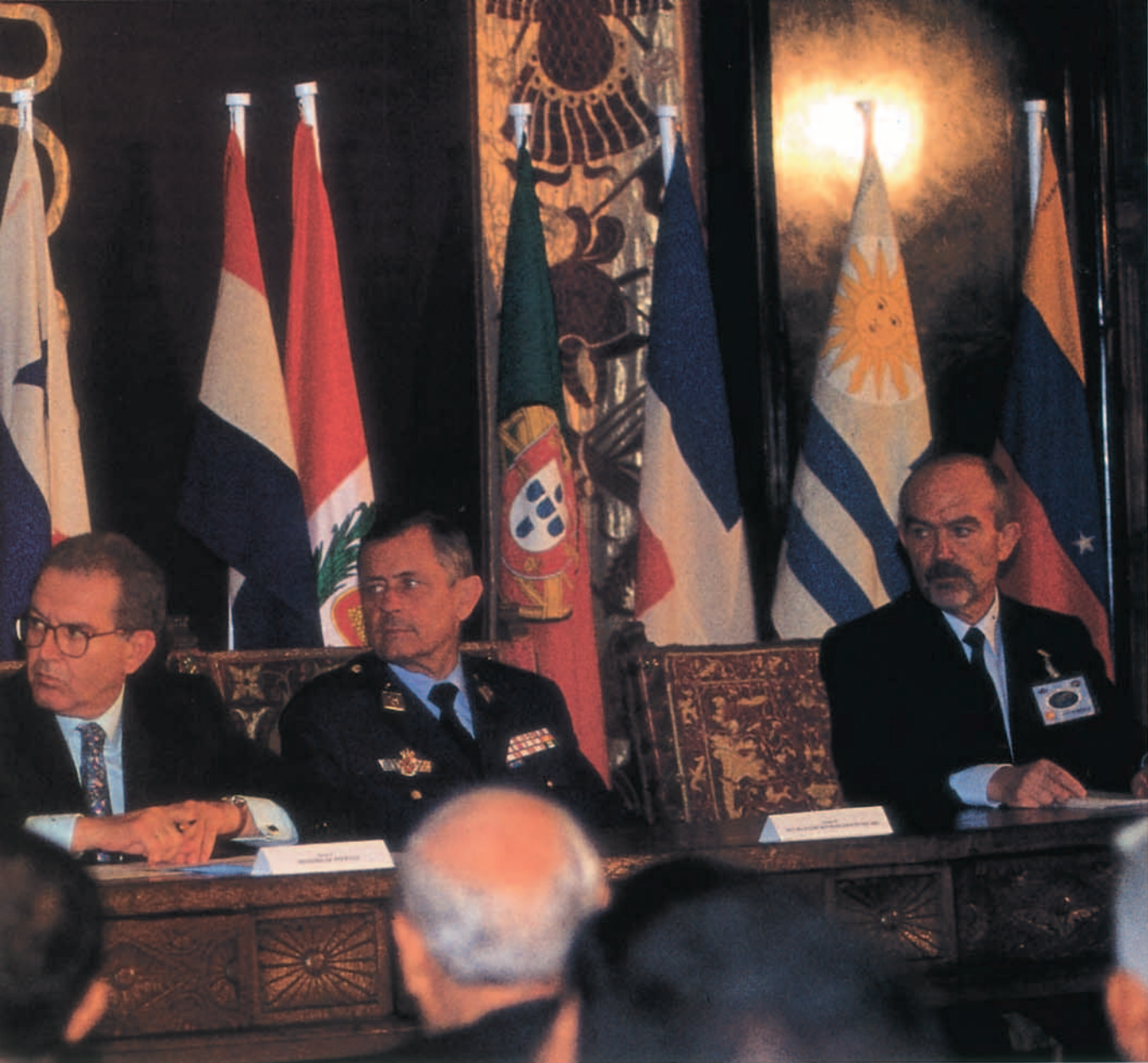
Mesa presidencial del acto de apertura con el presidente Pro Tempore de FIDEHAE, ministro de Defensa, general jefe del Estado Mayor del Ejército del Aire y el general director del SHYCEA y presidente de este V Congreso.

Témpore de la Novena Cumbre Iberoamericana de jefes de Estado y de Gobierno, a celebrar en el presente mes de noviembre en La Habana (Cuba), ha aceptado la inclusión del V Congreso Internacional de Historia Aeronáutica y Espacial en el calendario de los foros, seminarios y otras iniciativas celebradas en el marco de la Cumbre en calidad de Comité sectorial, noticia que llegó apenas dos días antes del inicio a