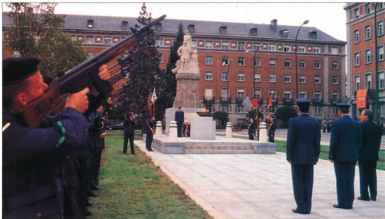
Salva de Honor en el Homenaje a los Caídos de la Aviación Iberoamericana.

pital chilena, se firmó el Acta de Santiago o Acta Constitutiva de FIDEHAE. 1997, III Congreso en Montevideo, donde los Estatutos serían aprobados. 1998, IV Congreso en Río de Janeiro, encuentro en el que se incorporaron a la Federación México y Venezuela. Actualmente son miembros de la FIDEHAE las siguientes naciones: Argentina, Bolivia, Brasil, Colombia, Chile, Ecuador, España, Méjico, Nicaragua, Paraguay, Perú, Uruguay y Venezuela, países a los que se han sumado Cuba, Panamá, Portugal y República Dominicana en este Quinto Congreso de Madrid.