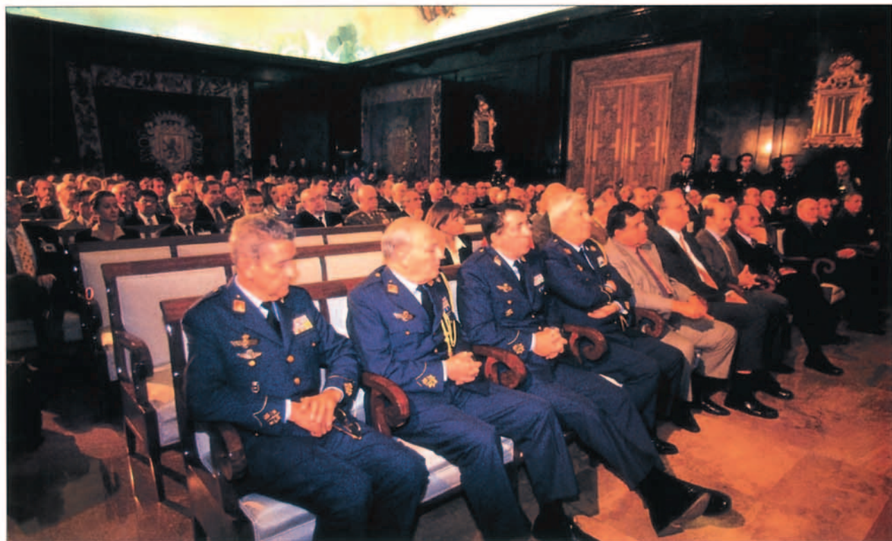
Autoridades militares y civiles presentes en el acto de apertura.