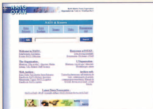
http://www.nato.int/ Página Oficial de la OTAN.

En los primeros días y mientras las infraestructuras de acceso a la red estaban intactas, grupos de hackers efectuaron ataques contra el servidor de la OTAN y otros servidores representativos de las fuerzas atacantes, como el sitio de la USAF y la propia Casa Blanca. Estos ataques tienen la forma de bombardeo de mensajes y de ‘ping’, un mensaje de interrogación destinado inicialmente a comprobar que un servidor está activo, pero que si se multiplica de forma suficiente puede saturar la capacidad de respuesta del ordenador interrogado. Aun-