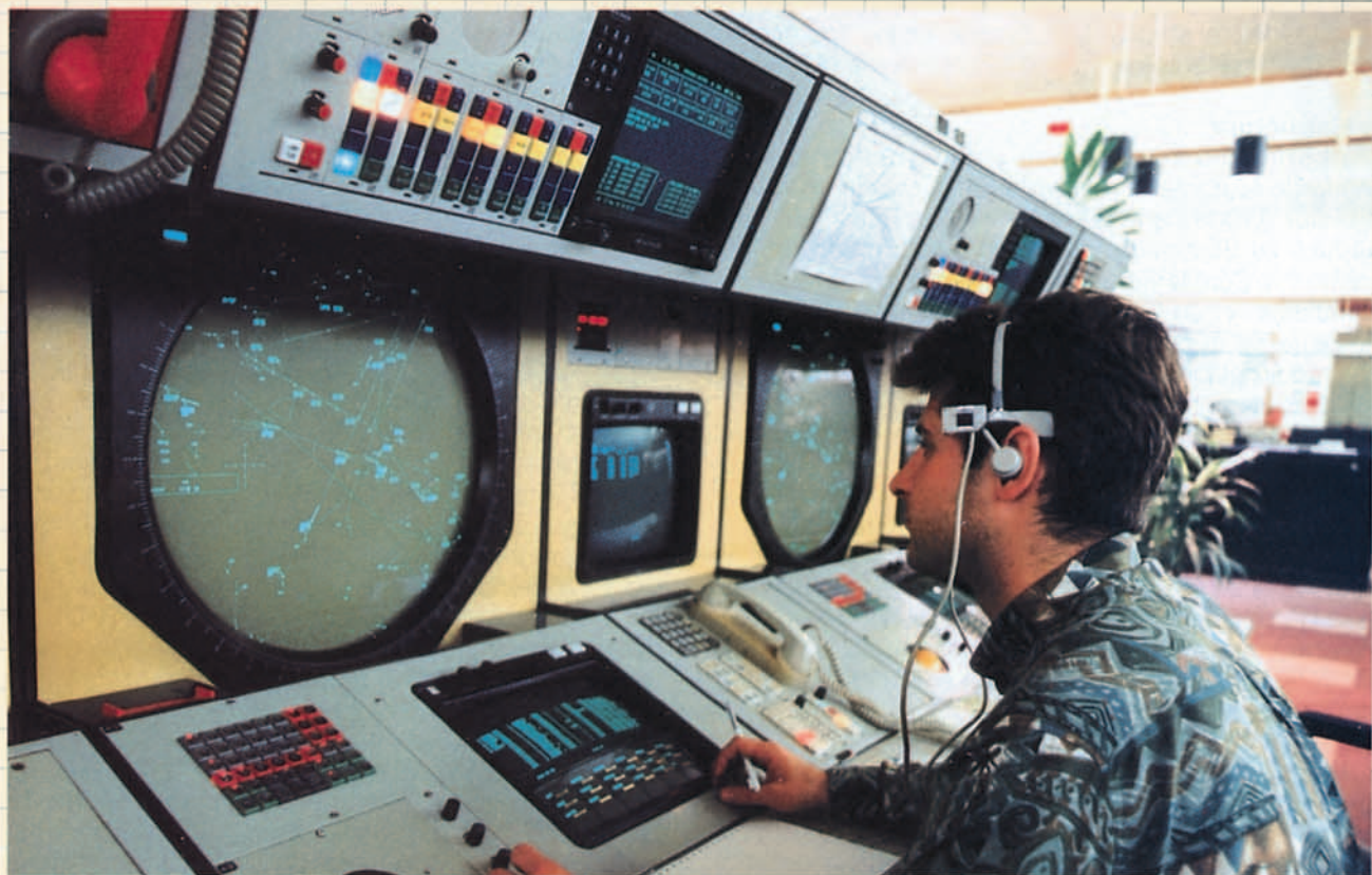
Uno de los más de 500 puestos de control del centro de Maastricht.

otros cuatro Estados que no lo eran; Portugal, Suiza, Austria y España. Este marco no daba al Sistema los suficientes poderes en materia de recuperación de deudas tanto por la vía judicial, como por la administrativa (retención de aeronaves) y no respondía a las necesidades de un Sistema que había comenzado en 1971 recuperando solo el 15% de los costes de los servicios prestados hasta llegar en diez años a una recuperación del 100 %. La principal carencia que se corregía con el nuevo Acuerdo Multilateral era la de articular debidamente los derechos de los Estados no miembros de EUROCONTROL que habían confiado a la Organización el cobro de estas tarifas. En efecto, aunque representantes de estos Estados eran invitados a participar en las reuniones de la "Comisión de Ministros" y otros órganos de ella dependientes cuando se ocupaba de temas relacionados con la Percepción de Tarifas, estos representantes tenían "voz" pero no "voto", por lo que las decisiones se tomaban, única y exclusivamente, con los votos de los Estados miembros, aunque es justo reconocer que estos siempre tuvieron en cuenta los intereses y puntos de vista de los otros Estados en las cuestiones a debatir.