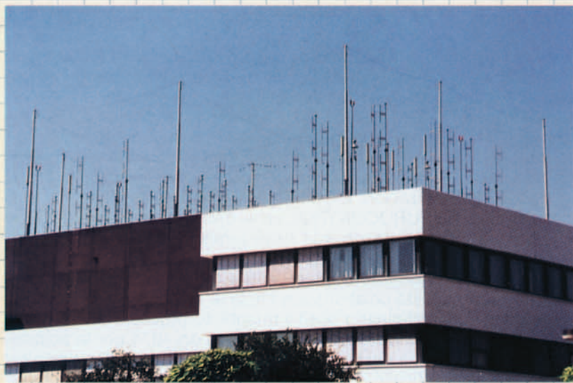
Centro de Control de Maastricht.

El antiguo marco que regulaba hasta 1986 el Sistema de Percepción de Tarifas era complejo y no articulaba debidamente los derechos y obligaciones de todos los Estados participantes que eran los siete Estados miembros de EUROCONTROL y