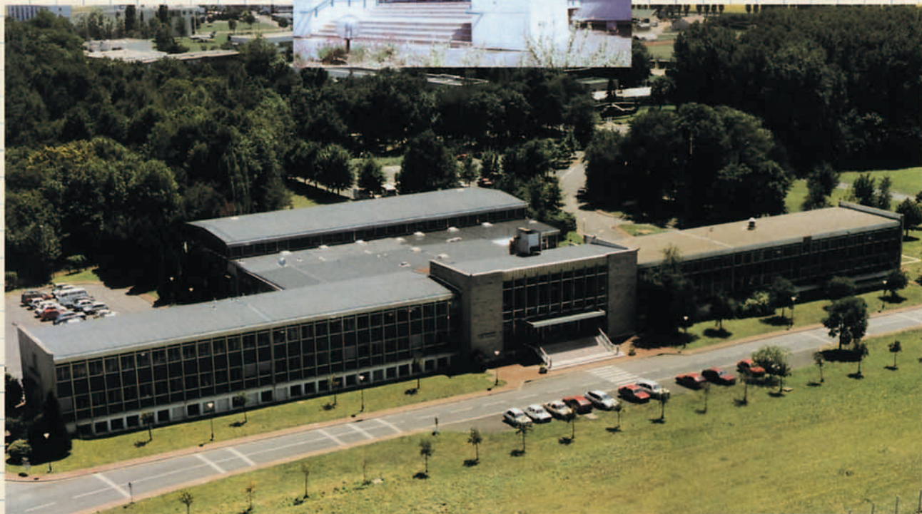
En 1967 se inauguró el Centro de Experimentación y ensayos de Brétigny (París).