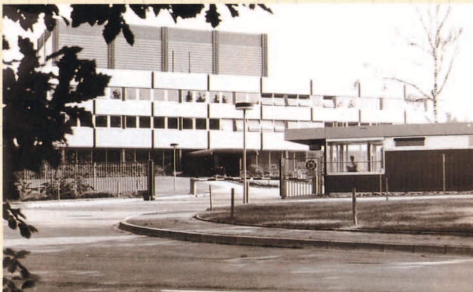
Centro de Control Aéreo de Karlsruhe.

En este contexto, EUROCONTROL decidió establecer un compás de espera que permitiese a los Estados reflexionar sobre la conveniencia de aplicar plenamente el Convenio de 1960 y transferir a la Organización las competencias y responsabilidades previstas. Pasado este periodo de reflexión, a