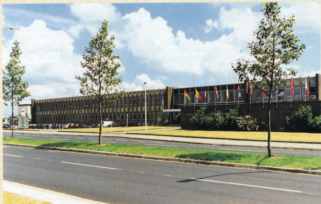
Instituto de la Navegación Aérea en Luxemburgo.

de un punto de vista jurídico, fruto de una falta de voluntad política, se debió a que la naturaleza de las responsabilidades y competencias que los Estados debían transferir a EUROCONTROL estaban estrechamente ligadas a la soberanía nacional; los intereses de la defensa; la política de seguridad, etc. etc. de sus miembros y no cupo la menor duda de que en la Europa Occidental de las décadas de los sesenta y setenta, no se había llegado a un grado de integración política que permitiese transferir este tipo de responsabilidades a ninguna de las instancias internacionales existentes; EUROCONTROL, NATO, CEE, etc. etc.