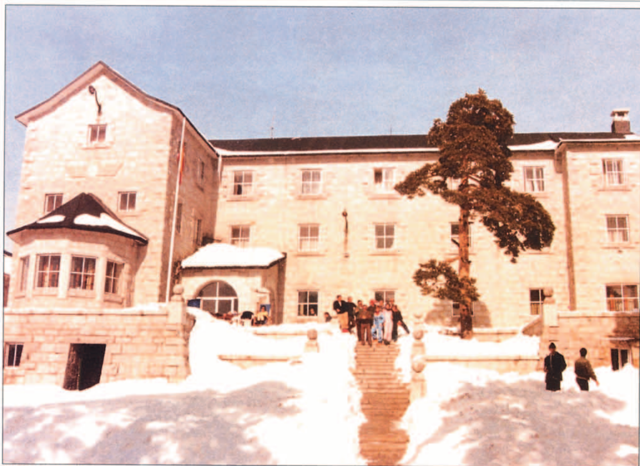
El Ejército del Aire, a través de su Dirección de Asistencia al Personal, dispone de seis residencias para la recuperación, reposo y esparcimiento del personal militar y civil funcionario así como de sus familiares, entre las que se encuentra la de "Los Cogorros" en Navacerrada.

Plantillas del año 1975. Este déficit se incrementa hasta el 17% si se tiene en cuenta la aportación del Ejército del Aire a otros organismos. El modelo de Ejército profesional puede suponer una nueva reducción de oficiales y suboficiales. Este descenso progresivo de efectivos ha venido acompañado por un incremento de cometidos (participación en nuevos programas, puestos en organizaciones internacionales, misiones de mantenimiento de la paz, etc.).