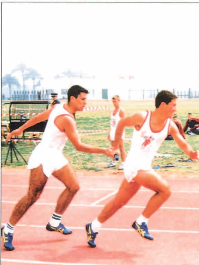
Los campeonatos deportivos tienen como finalidad el promocionar el interés por el deporte en el ámbito del Ejército del Aire.

Se presta especial atención al control de la enseñanza militar, propone y participa en convenios docentes así como la asistencia a cuantas reuniones científico-sanitarias sean estimadas de interés para el Ejército del Aire. En particular todas aquellas reuniones o congresos sanitarios militares en el marco de la OTAN, por la especial implicación que ello supone para nuestras FAS y en especial para el Ejército del Aire.