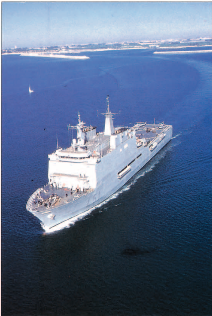
El buque "Galicia", al igual que otros medios de nuestras FAS, ha contribuido en la rápida respuesta de nuestro país ante la catástrofe producida por el huracán "Mitch" en países centroamericanos.

fensa internacionales, contribuyendo a elevar el prestigio de España y de sus Fuerzas Armadas. Continuamos de forma muy activa en misiones de Naciones Unidas en Guatemala (MINUGUA) y Angola (MONUA), en misiones de la OSCE en Georgia, Moldavia y Kosovo y en misiones de la Unión Europea en la ex-Yugoslavia (ECMMY).