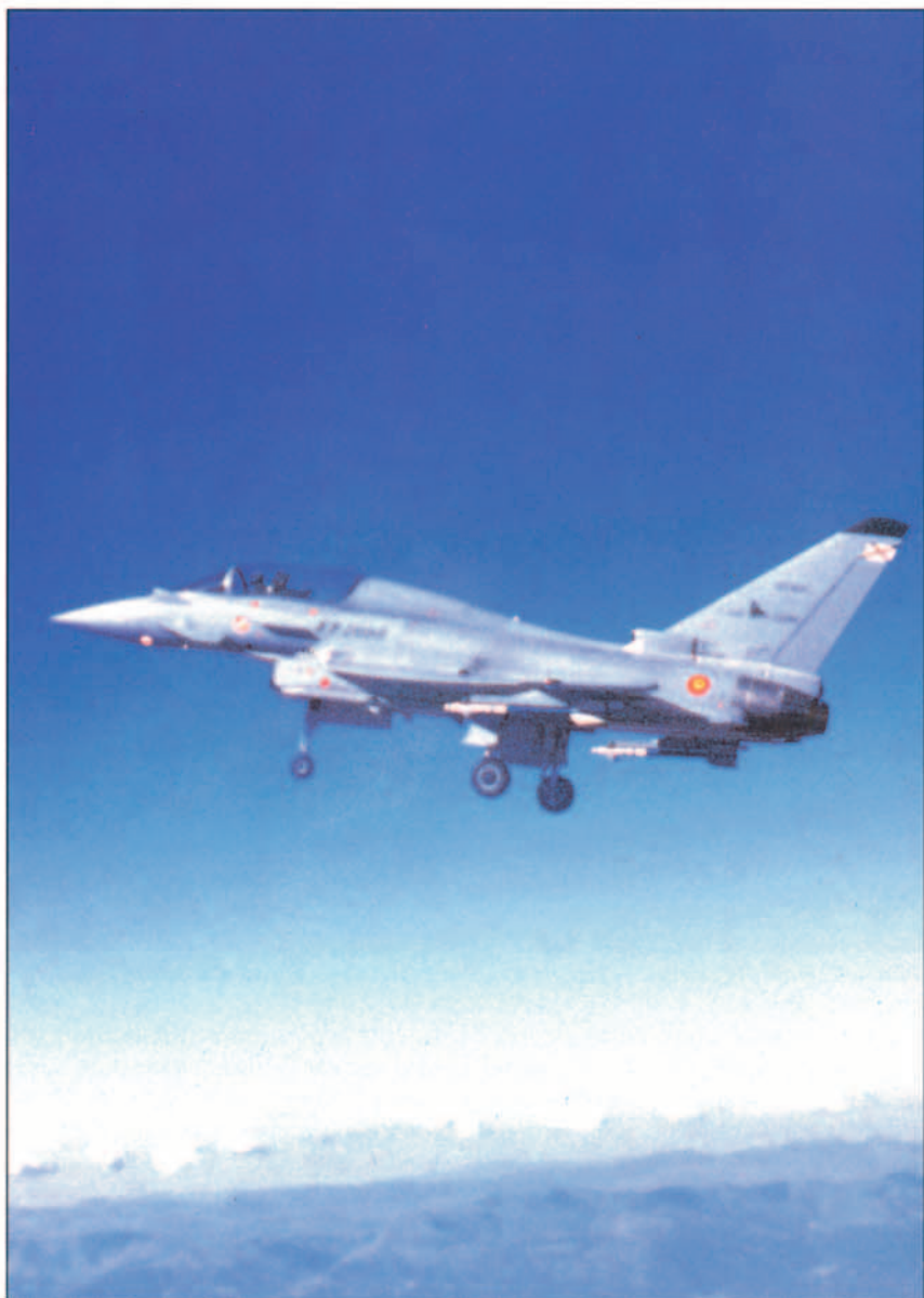
Para el Ejército del Aire, el EF-2000 representa uno de los más claros exponentes de lo que han significado los programas de modernización para nuestras Fuerzas Armadas.

Resaltar la incorporación del E.A. al EURAIRGROUP (EAG), órgano de E.M. aeronáutico militar para coordinar las fuerzas aéreas de Alemania, Bélgica, Francia, Holanda, Italia, Reino Unido y ahora España, para sus actividades y participación en misiones multinacionales.