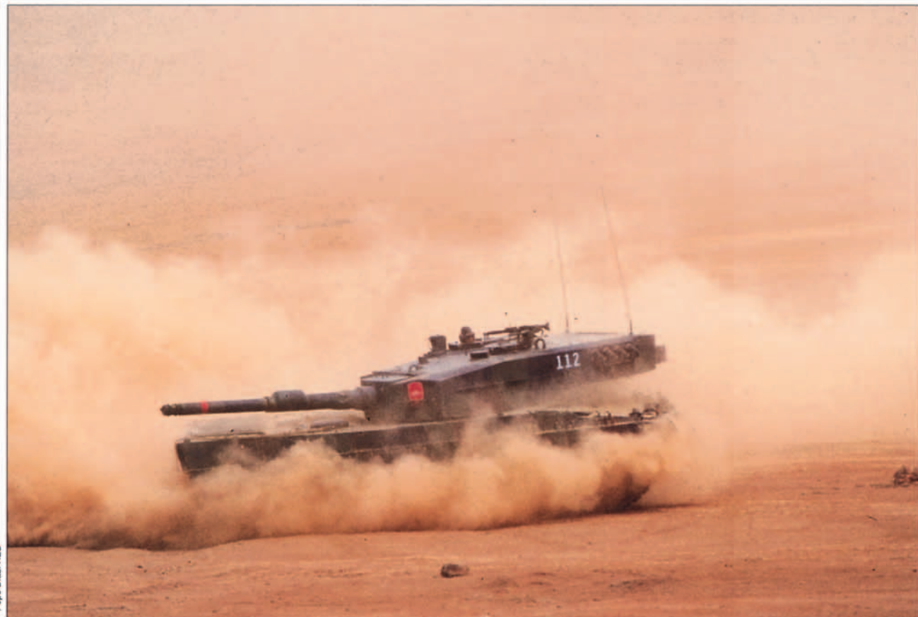
Para el Ejército de Tierra, el carro de combate Leopard es el sistema de armas que representa su modernización de cara al siglo XXI.

virán para colocarnos, en lo que respecta al armamento, en la vanguardia de la tecnología militar, así como contribuir a la potenciación de nuestra industria de defensa.