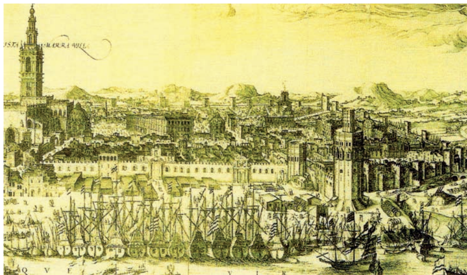
Sevilla, con el Guadalquivir repleto de barcos esperando la orden de partida y la Torre del Oro, dominando el Arenal. Museo Naval de Madrid.