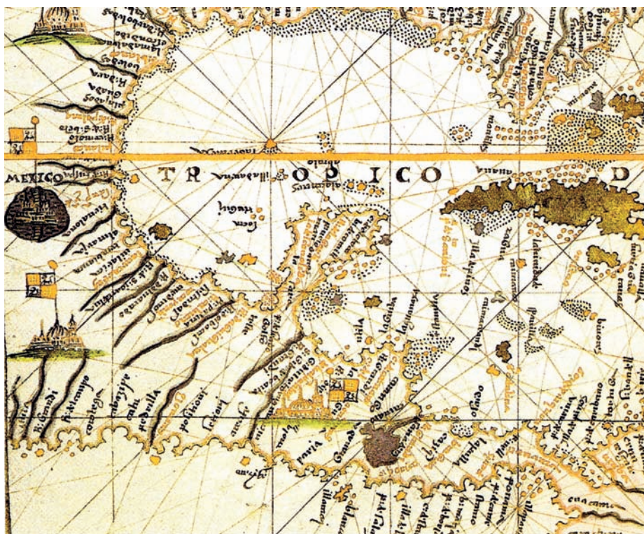
Mapa del Caribe y occidente de Cuba. Ya en el siglo XVII se tenía una mejor idea de las costas de Cuba, pero el conocimiento seguía siendo deficitario.

Roelas a bordo de la nao San Salvador dejó Dominica a popa buscando La Española, no sabemos si tocó tierra en este punto, pero es muy probable que lo hubiera hecho. Luego continuó bojeando el peligroso sur de Cuba, preñado de islotes, parajes desconocidos, corrientes y bajos poco estudiados por los pilotos españoles, recordaremos que estamos en 1563.