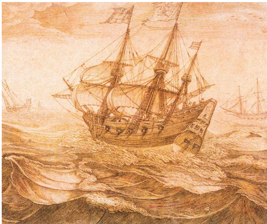
Barcos en medio de una mar que comienza a moverse, presagiando tormenta. Biblioteca Nacional de Madrid.