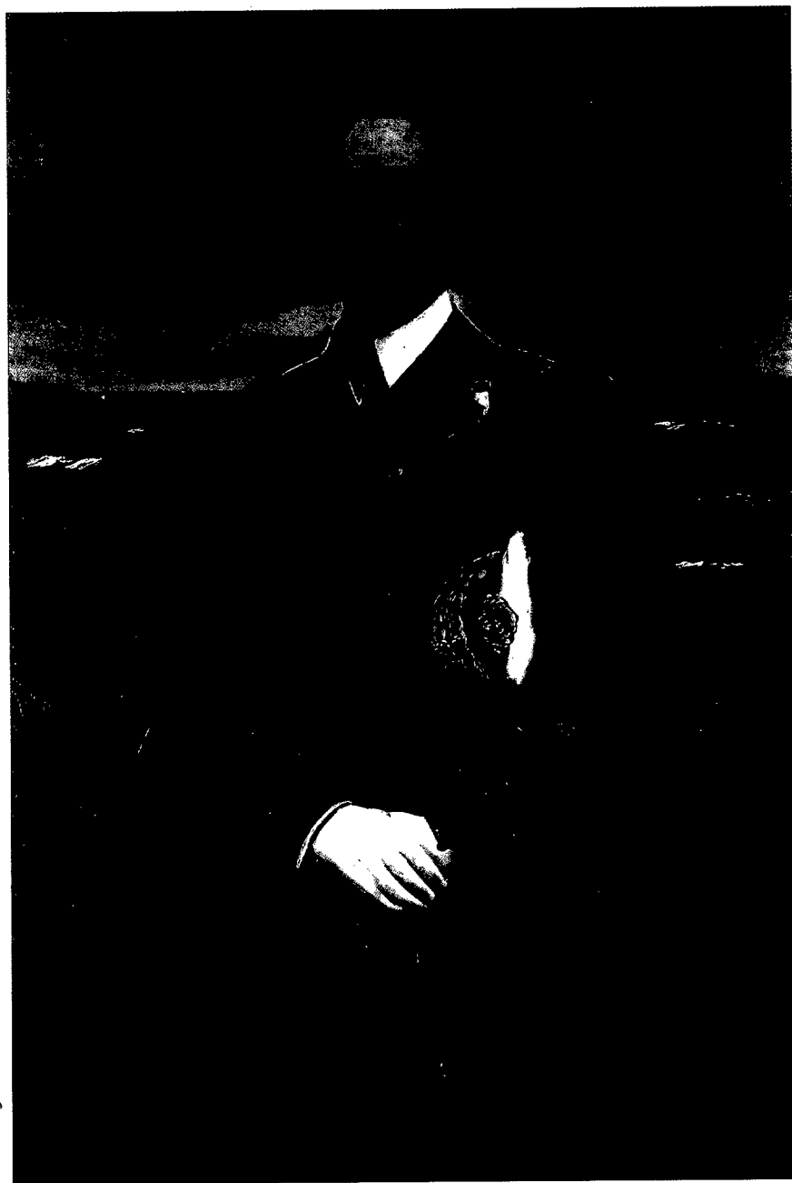
Retrato de Alfonso XIII, Rey de España (1886-1941). Autor anónimo. Óleo sobre lienzo, 117 x 80 cm. Palacio del Viso del Marqués. Museo Naval, Madrid