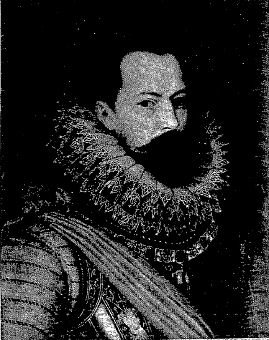
ALEXANDER FARNESE, DUKE OF PARMIA

From a portrait by Otto van Veen in the Musée de Peinture Ancienne, Brussels.