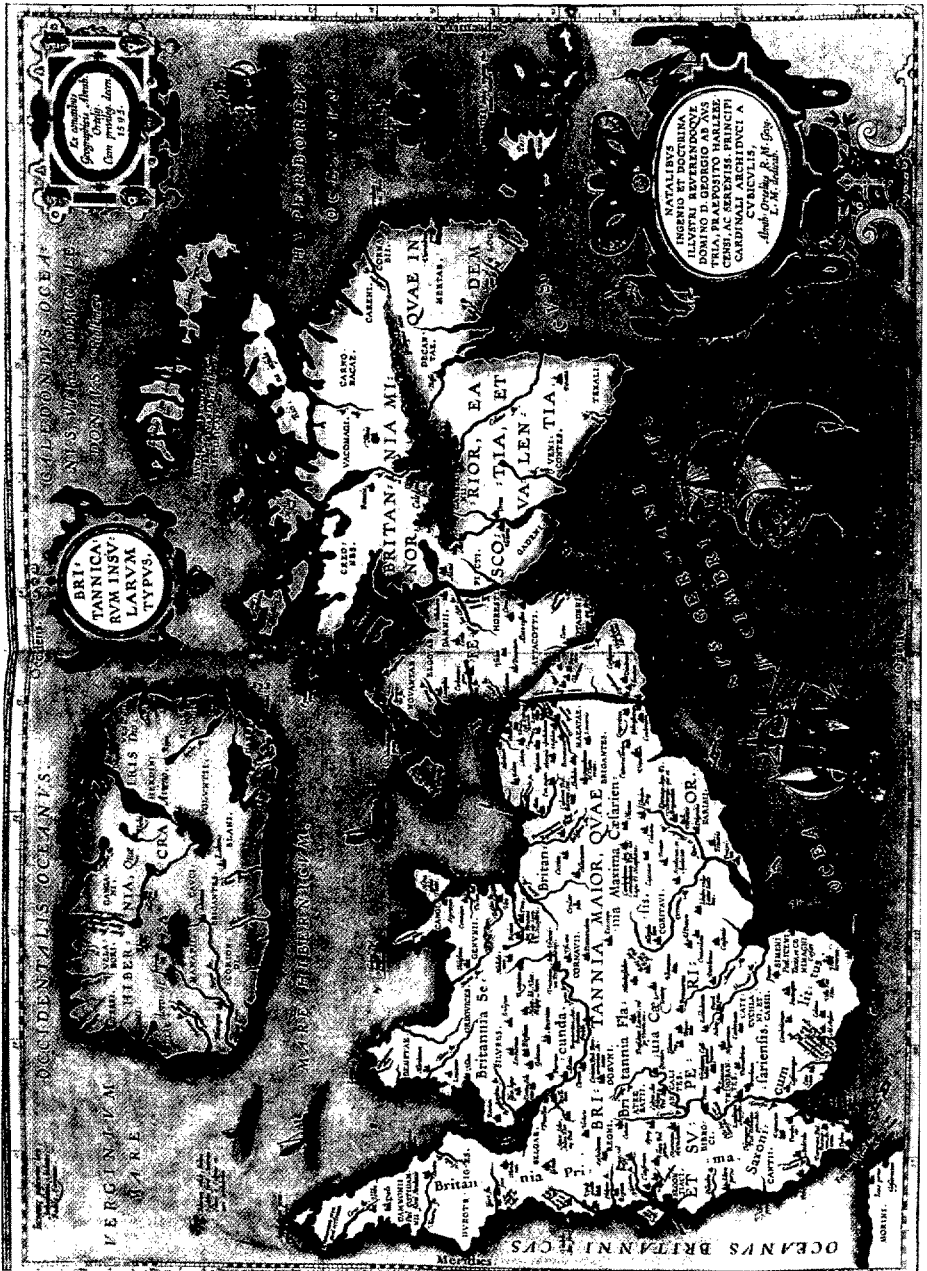
Mapa de la Gran Bretaña, tomado de la obra de Abraham Ortelius: Theatrum Orbis Terrarum .