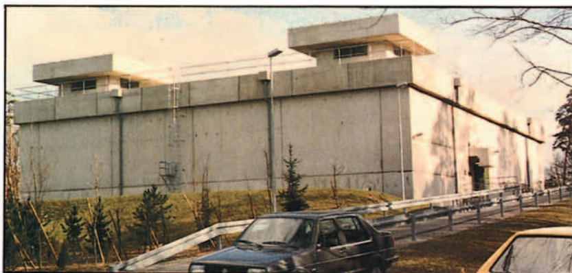
Edificio de apoyo al CF 18.

CFB Baden recibió su primer Escuadrón de aviones CF-18 en julio de 1985. El Escuadrón 409 "Nigh-