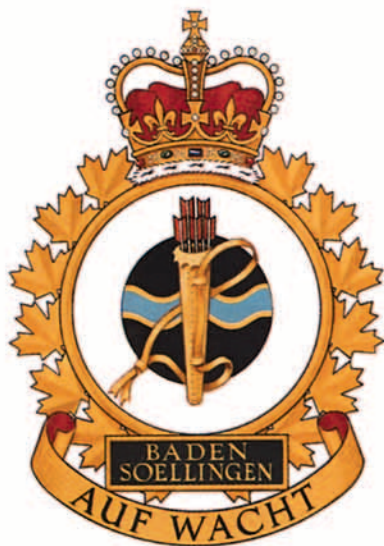
Emblema de la Base de las Fuerzas Aéreas Canadienses de Baden-Soellingen.

El Ala número 4 (F) desplegada en la Base de las Reales Fuerzas Aéreas Canadienses (RCAF) de Baden-Soellingen formaba parte de la División Aérea número 1 de las RCAF en Europa. El Cuartel General de la División Aérea estaba ubicado en Metz, Francia. Esta División Aérea fue la contribución aérea de Canadá a la Cuarta Fuerza Aérea Táctica Aliada