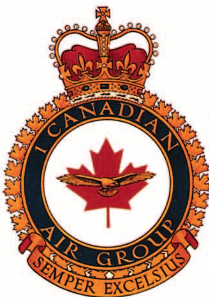
Emblema del 1.º Grupo Aéreo Canadiense.

Una vez completado este entrenamiento los pilotos son declarados aptos para el combate según los requisitos OTAN. Una vez alcanzada esta calificación, el piloto empieza a entrenarse para los cometidos que le serán asignados en tiempo de guerra. La actual política de las Fuerzas Canadienses es proporcionar a cada piloto de CF-18 240 horas de vuelo anuales para realizar