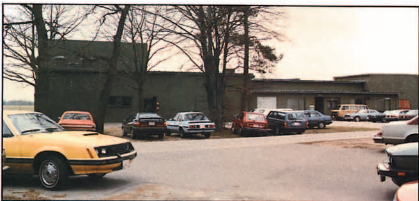
Instalación para entrenamiento en tierra.