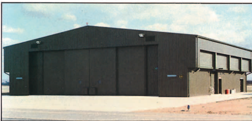
Instalación para pruebas de motores F-404.