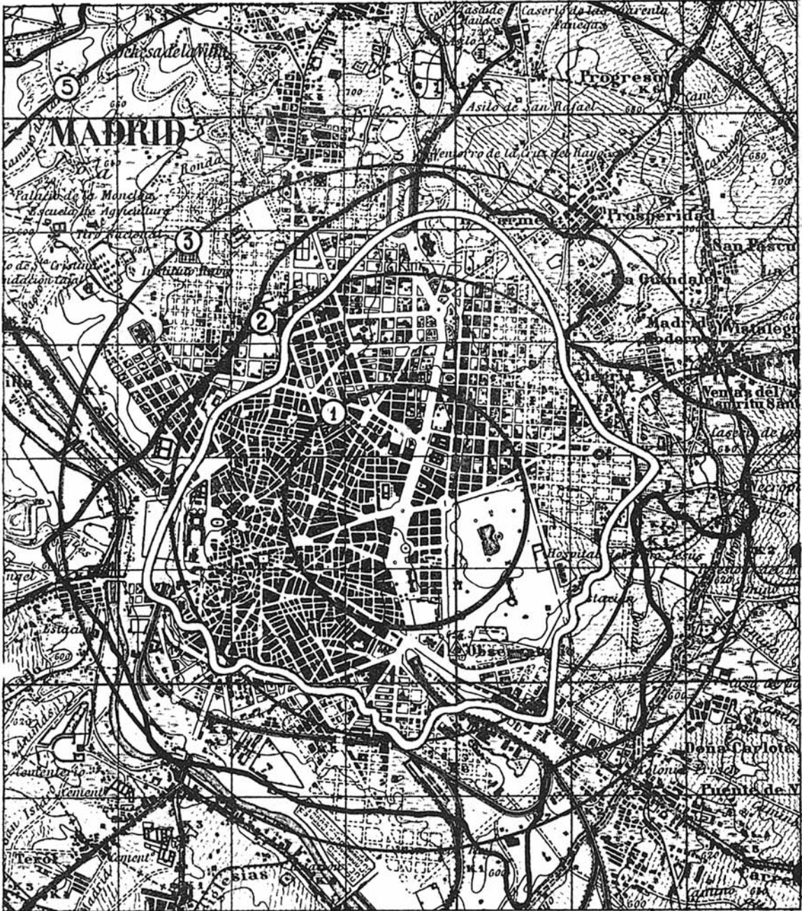
Efecto aproximado que produciría una bomba atómica lanzada en Madrid que hiciese explosión en la vertical de la Cibeles.