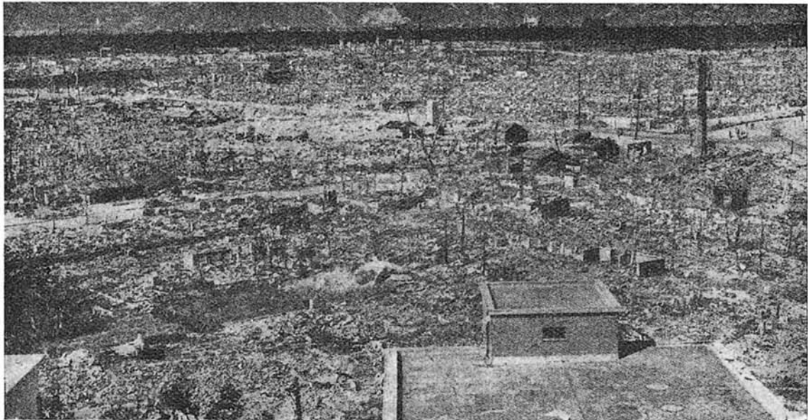
Efectos del bombardeo atómico contra Hiroshima.