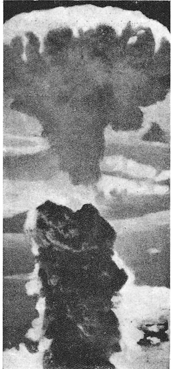
Esta altísima columna de humo y escombros fué producida por la segunda bomba atómica lanzada en Nagasaky.

El aspecto que presentan las fotografías obtenidas en Hiroshima tras el ataque es el de una ciudad incendiada, en la que se observan todos los mismos detalles que en las de Tokio, Kobe Osaka y tantas otras ciudades sometidas por la AAF a devastadores ataques con bombas incendiarias; en todas ellas los edificios de madera han ar-