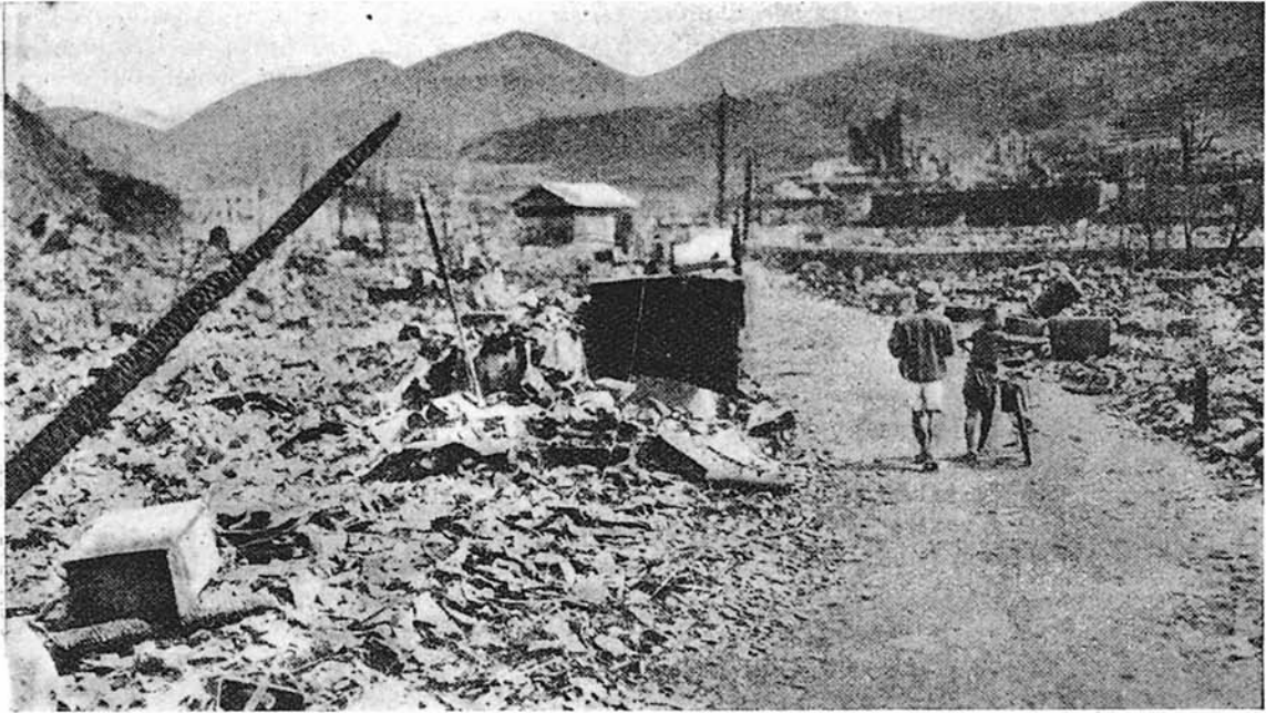
Otra vista de Hiroshima en la que se aprecian los efectos destructores de la bomba atómica.

cual la mayor parte de estas células nacen. Los efectos realmente serios aparecen cuando las células de la sangre adulta mueren naturalmente y no son reemplazadas por otras "elaboradas" en la medula. En los casos graves, fué evidente que los rayos Gamma habían destruído totalmente la medula ósea. En tales casos, los glóbulos rojos, leucocitos y plaquetas, pronto aparecían en formas caducas. En cuanto cesaba la formación de los glóbulos rojos, el paciente empezaba a sufrir de anemia progresiva, y al cesar la formación de las plaquetas, la sangre se desparramaba bajo la piel, en la retina y en los riñones. Otros pacientes morían al desaparecer la resistencia a la infección por la destrucción de los glóbulos blancos, en una combinación de gangrena de labios, boca y garganta, con hemorragias internas, anemia e infección. Las muertes comenzaron alrededor de los siete días después de la explosión, alcanzaban el máximo alrededor de las tres semanas, y la mayor parte de las veces habían cesado al cabo de mes y medio o dos meses.