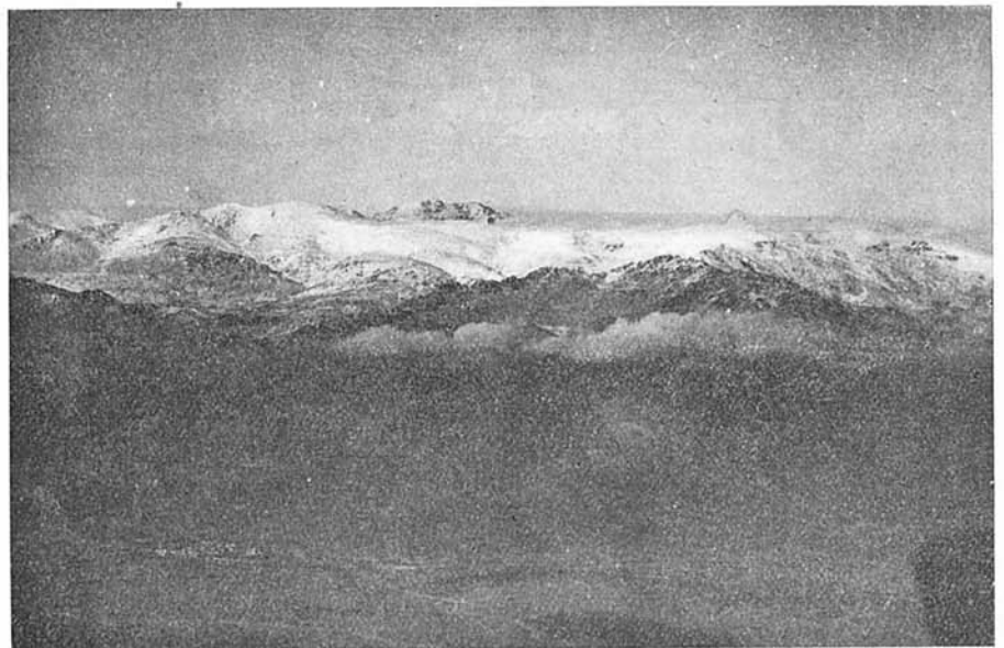
El despertar en Manzanares el Real.

Dicese que aquellos a quienes el Nublero visita, reciben de él la invitación de devolvérsela en la Ciudad del Grito, y acuciados desde aquel mismo momento por