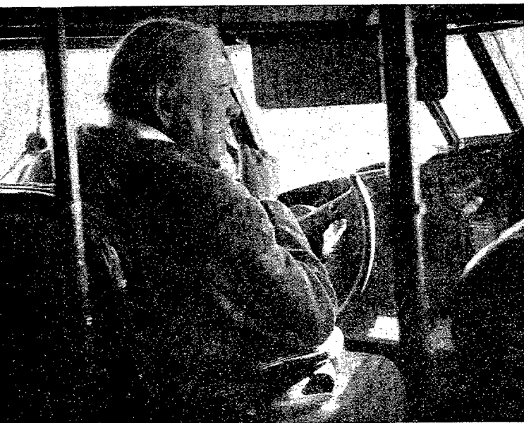
El Premier británico, Winston Churchill, al volante del "clipper" Berwick, en que atravesó el Atlántico.

"La mañana era muy fría y el tiempo bastante tranquilo. Largué la boya antes de poner en marcha los motores. Había una lancha en las proximidades para caso de apuro, pero no hubo necesidad de emplearla; los motores arrancaron en seguida y a los ocho minutos habíamos despegado.