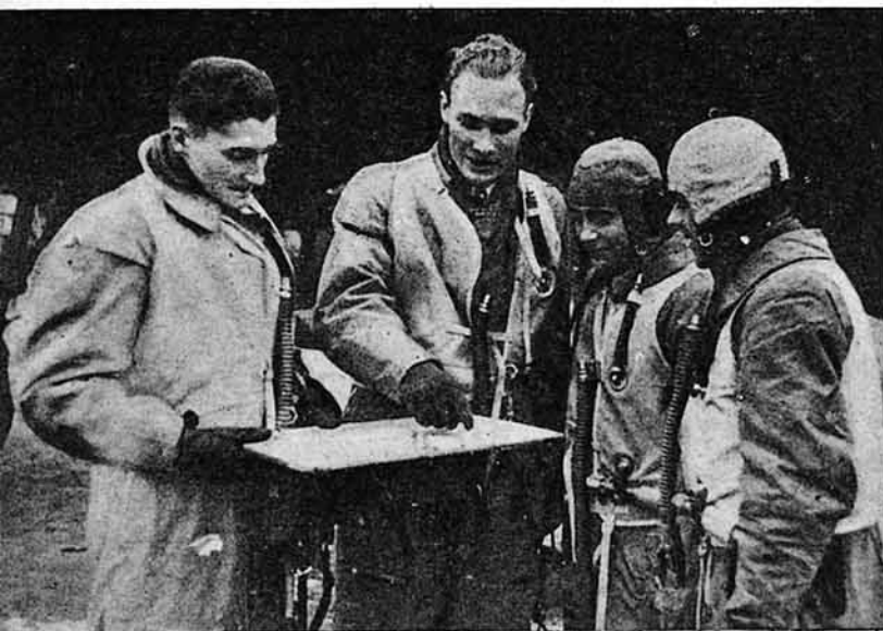
Una tripulación de la Luftwaffe dando cuenta, sobre el plano, del resultado de un vuelo de exploración sobre el mar.

Otras veces la información exigirá llevar los reconocimientos más allá de los límites del Cuerpo de Ejército, en cuyo caso el Ejército pondrá a disposición del mando de aquél sus