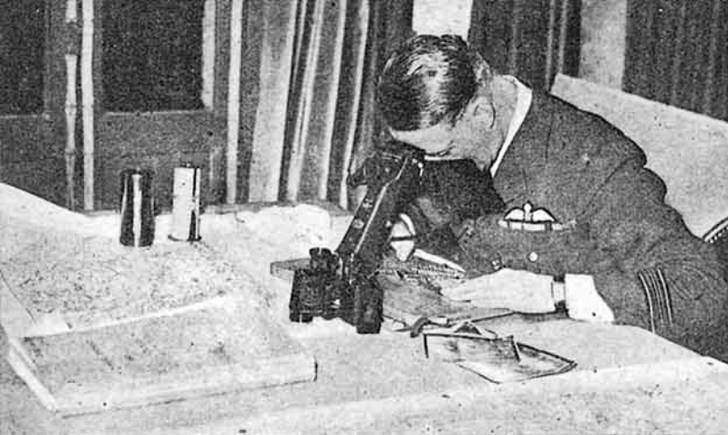
Un oficial de la R. A. F. examina e interpreta fotografías aéreas de los territorios enemigos.

Base de ello es la selección del personal que haya de emplearse y la necesidad de establecer en él una sólida disciplina que le ponga al abrigo de toda indiscreción.