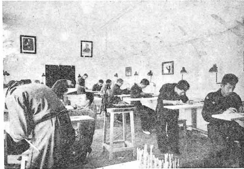
Un aspecto del Taller-Escuela Central de Aeromodelismo, recientemente inaugurada en Madrid.

El fuselaje está formado por dos listones de made-