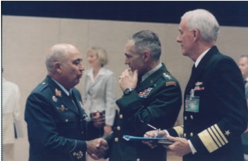
El general del Aire Valderas, que tuvo una participación muy activa en la negociación de los acuerdos de coordinación, fue posteriormente como JEMAD quien protagonizó los aspectos militares de nuestra integración en la estructura de mando de la OTAN. En la fotografía el general del Aire Valderas con el general Clark (SACEUR) y el almirante Gehman (SACLANT). Bruselas 18 de junio de 1999.

ge la actividad diaria del CG apoyado por un pequeño Estado Mayor de poco más de treinta personas procedentes de los siete países que forman el GAE. Ese Estado Mayor tiene a su frente un coronel del que dependían seis secciones mandadas por un teniente coronel. Esta estructura ha sido objeto de varios retoques y cambios existiendo ahora un Secretariado Ejecutivo y seis áreas, reconociéndose que no se trata de un Estado Mayor tradicional al no tener fuerzas a su cargo ni realizar planeamiento operativo. Además de esta estructura y trabajando en paralelo con ella están los grupos de trabajo los cuales supervisan y estudian los conceptos, los sistemas, equipos, etc. El GAE es un órgano de cooperación y de consulta pero no operativo que facilita los objetivos de la OTAN y que ayuda al desarrollo de los conceptos relacionados con el esfuerzo aéreo en la Unión Europea. El GAE trabaja también en la programación de objetivos y creó el año 2002 la "Célula Coordinadora para el Transporte Aéreo y el Reabastecimiento" (EACC) con base en Eindhoven, los Países Bajos. El GAE es un foro permanente para hablar de problemas comunes a las fuerzas aéreas de los países que lo forman y aprovechar sus experiencias.