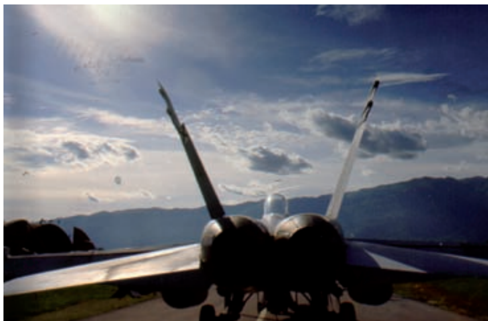
Un C-15 participante en la operación “Allied Force”. Primavera 1999

La total profesionalización de las Fuerzas Armadas que fue finalizada al comienzo de los años 2000, no tuvo un impacto significativo en el EA donde la mayor parte del personal operativo ha sido casi siempre profesional. Sin embargo, en el EA se ha trabajado intensamente por mejorar las instalaciones y servicios en las bases y acuartelamientos aéreos especialmente las dedicadas a personal de tropa. Los profundos cambios en la sociedad española en las dos últimas décadas