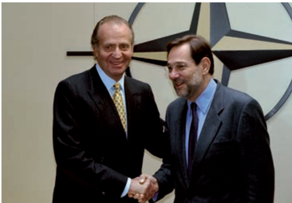
SM el Rey Don Juan Carlos I estrecha la mano del Secretario General de la OTAN durante su visita al CG de Bruselas. 26 de abril de 1996.

De acuerdo con un nuevo marco y organización de la Estructura de Mando de la Alianza, aprobada por los ministros de Defensa en la reunión del CAN de 12 de junio de 2003, el JHQSWS perdió su carácter conjunto y territorial transformándose en