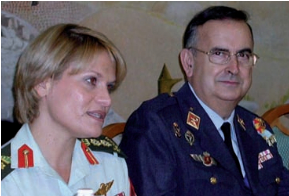
La Princesa Aisha de Jordania, representante de su país en la reunión preparatoria del programa militar del Diálogo Mediterráneo. Bruselas, 12 de septiembre de 2003.

El año 2010 se ha celebrado el XXV aniversario de la Patrulla Águila que ha llevado las alas de España a todo el mundo. Heredera de la tradición de patrullas como Ascuá, Amigo y otras, la Patrulla Águila ha dado a conocer la preparación y calidad de nuestros pilotos en cuantas exhibiciones el «Spanish Acrobatic Team» ha estado presente.