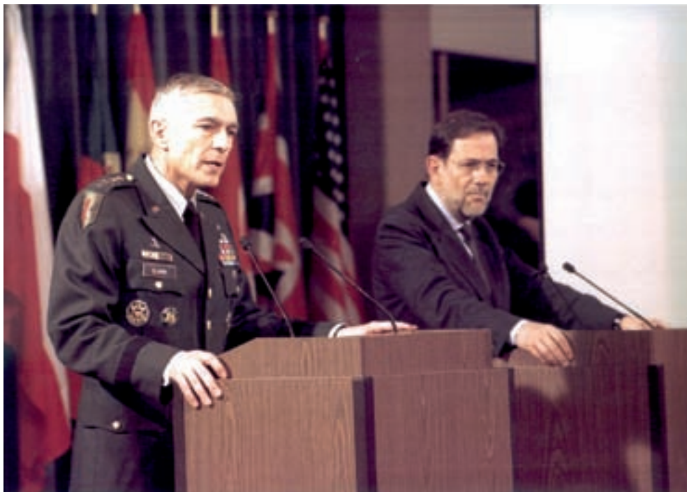
El general Clark, SACEUR y el Secretario General de la OTAN Sr. Solana, informando de la marcha de la operación "Allied Force". Cuartel General de la OTAN. Primavera 1999.

número de Cuarteles Generales, el desarrollo de la IESD (Iniciativa Europea de Seguridad y Defensa) dentro de la Alianza y que a España se le asignarían responsabilidades, especialmente en los mandos establecidos en nuestro área de interés.