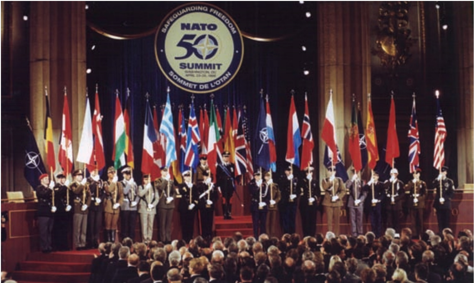
La cumbre de Washington marcó un hito en la vida de la Alianza. Celebrada el 23 de abril de 1999 en ella se aprobó el concepto estratégico que ha estado vigente hasta la cumbre de Lisboa del 19 y 20 de noviembre de 2010.

so las actividades preparatorias fueron especialmente complejas y culminaron en mayo de 2009 con el lanzamiento en el polígono de tiro de Overberg (Unión Sudafricana) de dos misiles KEPD-350 "Taurus" desde plataformas C-15M.