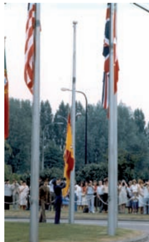
Con la entrada de España en la OTAN el Ejército del Aire incrementa muy notablemente su proyección exterior.

Los seis AC en su conjunto involucrarían a la mayoría de las FAS españolas que desarrollarían principalmente sus actividades dentro del área normal española de