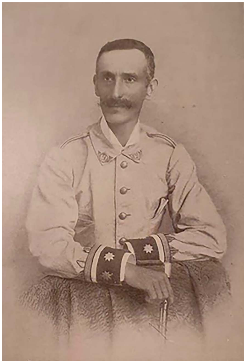
Figura n.º 3. Grabado del comandante Francisco Cirujeda y Cirujeda 59