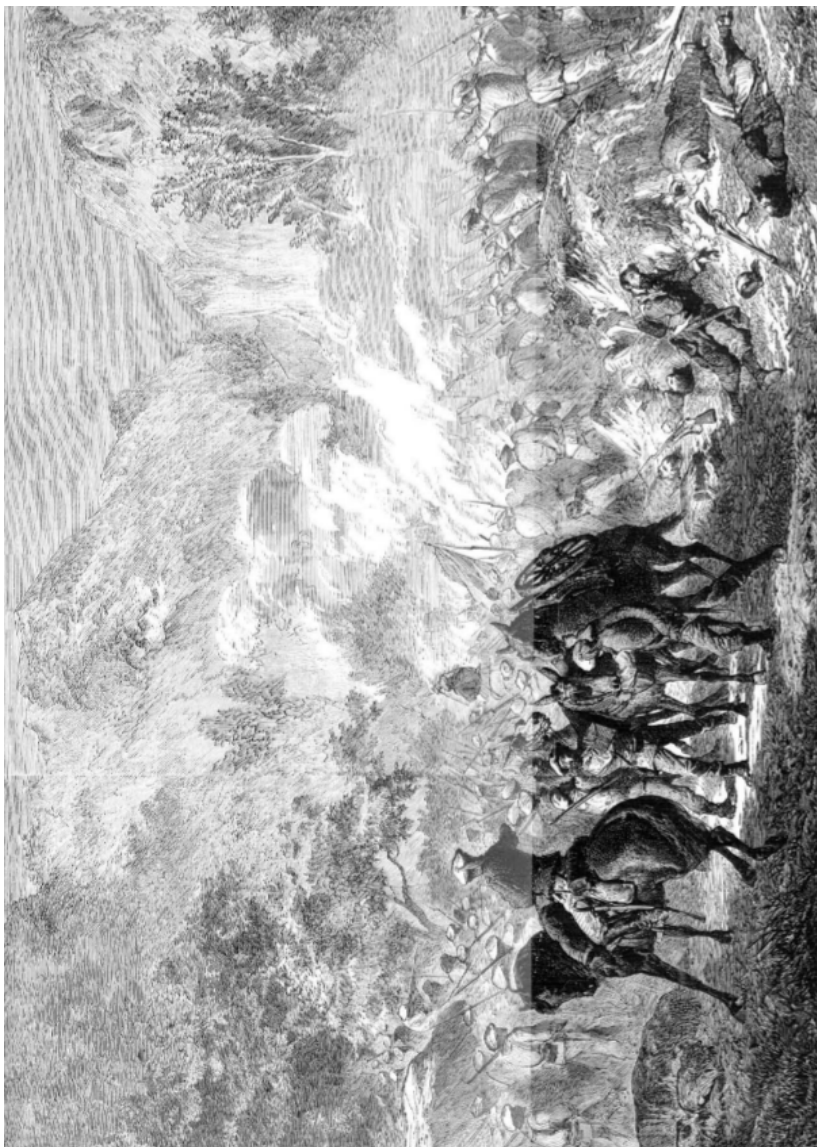
Figura n.º 1. Acción de Eraul entre la columna mandada por el coronel Navarro y las facciones del general Dorregaray.