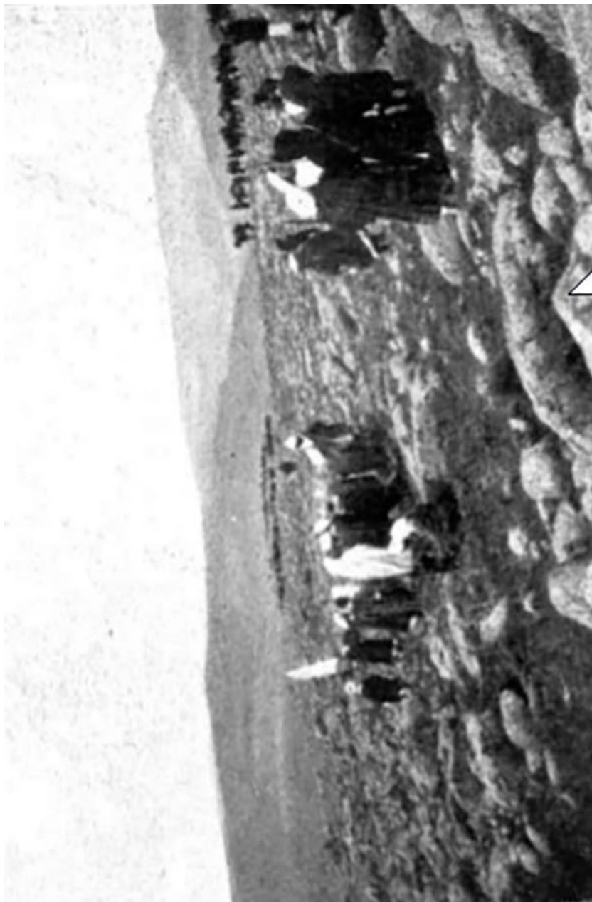
Figura n.º 4. Prisioneros hechos en el collado de Atlatén (1909) 61