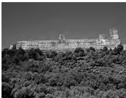
Vista de las ruinas de la antiguo salón de los Reyes.

El problema era que la Corona nunca tuvo la voluntad de salvar una fortaleza que ya no tenía la importancia estratégica de antaño. Todas las fortalezas de la Corona tenían unas rentas asignadas para sus reparos. ¿Qué rentas tenían asignados los alcázares de Carmona?, pues, la renta del diezmo de cal y barro de la propia localidad. Esta renta la arrendaban los alcaides y pagaban en tiempos de don Fadrique entre 30.000 y 60.000 maravedís anuales. La renta era bajísima, ínfima, teniendo en cuenta que con ella había que mantener los dos alcázares de la localidad. Por poner un ejemplo comparativo, por aquel entonces las rentas asignadas al alcázar de Sevilla se cifraban en unos 12.000 ducados, es decir, casi 4,5 millones de maravedís. Por lo tanto, las rentas de que disponían los alcázares de Carmona suponían aproximadamente el uno por ciento de las que disfrutaban los de Sevilla. Para colmo, los barreros y los caleros interpusieron un pleito, que apelaron hasta la audiencia de Granada para no pagar dicha renta. En 1592 se decía que llevaban diez años sin abonarlas, esperando la resolución judicial.