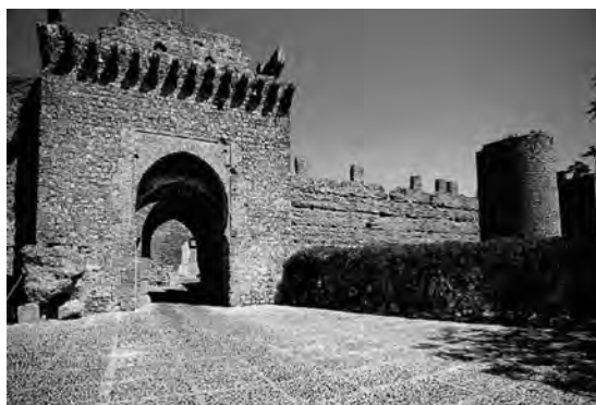
Puerta de acceso al alcázar en su estado actual.

llamaban de los Reyes, estaban terraplenados , es decir, estaban formados por tierra prensada. De la visita de los alarifes al edificio se entrevén algunos datos de interés. Dicen que primero visitaron la puerta de la torre del Homenaje, que es la puerta que dicen de la Piedad . Ya Fernández López, a finales del siglo XIX, citando a López de la Barrera, afirmó que esta puerta se conocía así desde la Reconquista (Fernández López, 1996: 282). Asimismo, visitaron la habitación donde se ubicaban las tahonas. Fernández López las intentó buscar en diversas excavaciones que practicó en el último tercio del siglo XIX, pero nunca las localizó ( Ibidem : 183-184). Seguidamente accedieron a dos bodegas, una más grande que la otra, al aljibe, al palomar, a las caballerizas, a un pajar, a la carnicería, a la noria y a dos graneros de trigo, uno junto al pajar y el otro encima de las caballerizas. Tal como se accedía a la plaza de armas, a mano derecha, se encontraba una habitación que, según afirman, tenía bóveda de aristas y el suelo igualmente terraplenado .