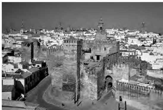
Vista panorámica del alcázar de Abajo o de la Puerta Sevilla. Al fondo en la parte superior se observan los restos del alcázar de Arriba.

Nada hacía sospechar entonces que esta majestuosa fortaleza, que alcanzó su esplendor en los siglos XIV y XV, iba a entrar en una triste agonía a partir de 1504. Dos hechos fatales se congraciaron en este año, a saber: la devastación que provocó el terremoto de Carmona de 1504, de la que nunca se llegó a recuperar totalmente, y la muerte de Isabel la Católica, la última soberana que veló por su conservación, e incluso, por su engrandecimiento. Frente a lo que se ha afirmado tradicionalmente, no fue el terremoto de Lisboa de 1755 el que lo arruinó, pues ya estaba abandonado a su suerte a mediados del siglo XVII.