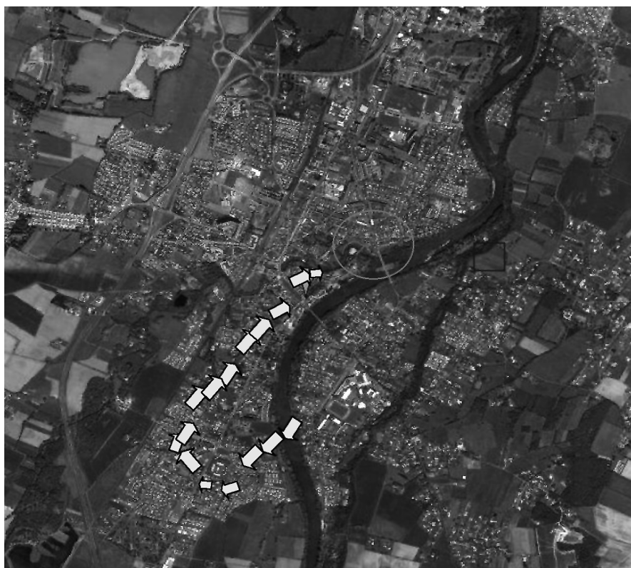
Muret en la actualidad; las señales indican el movimiento realizado por las fuerzas cruzadas, el círculo el campo de batalla, y el rectángulo el lugar del campamento hispano-occitano.

El ejército hispano-occitano estaba dispuesto para la batalla, seguramente ya en formación de combate, o en el peor de los casos, en estado de alerta para poder intervenir ante una eventual salida de los cruzados para entablar batalla.