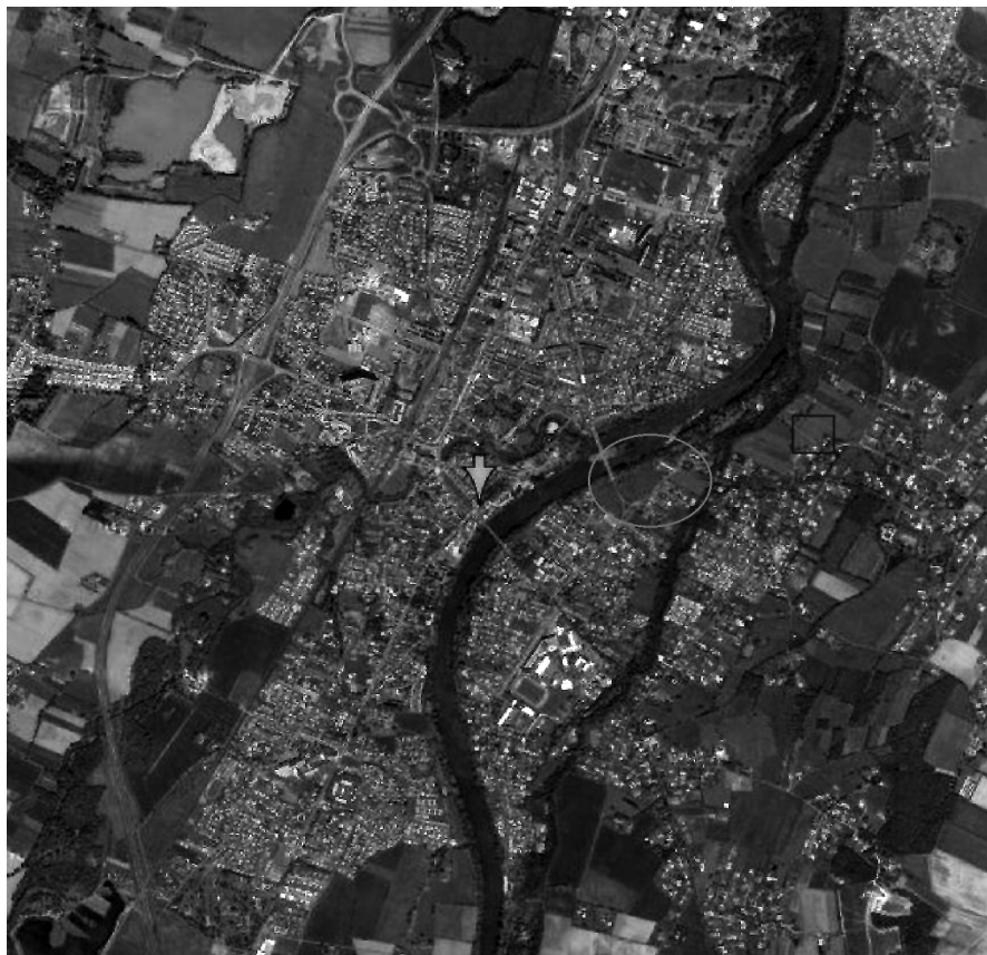
Muret en la actualidad; la señal indica el lugar de salida de las fuerzas cruzadas, el círculo el campo de batalla, y el rectángulo el lugar del campamento hispano-occitano.

En la batalla de Muret los bandos enfrentados consistieron en una coalición de fuerzas hispano-occitanas contra fuerzas de voluntarios cruzados. La coalición estaba formada por la Corona de Aragón, el condado de Tolosa y los principales nobles feudales transpirenáticos, que se encontraban ligados a los dos primeros por razones feudo-vasalláticas. Los