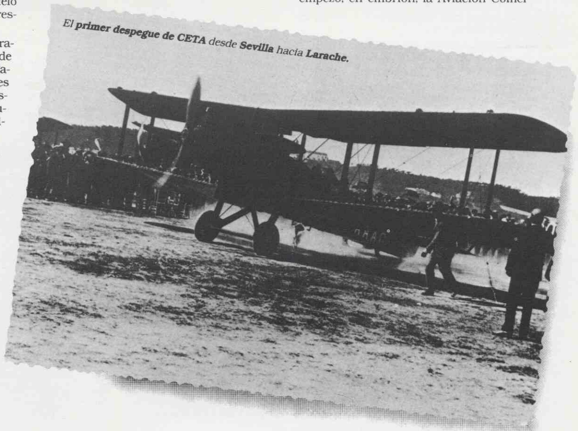
El primer despegue de CETA desde Sevilla hacia Larache.

Y salió el "Sevilla" para Africa. Y empezó, en embrión, la Aviación Comer-