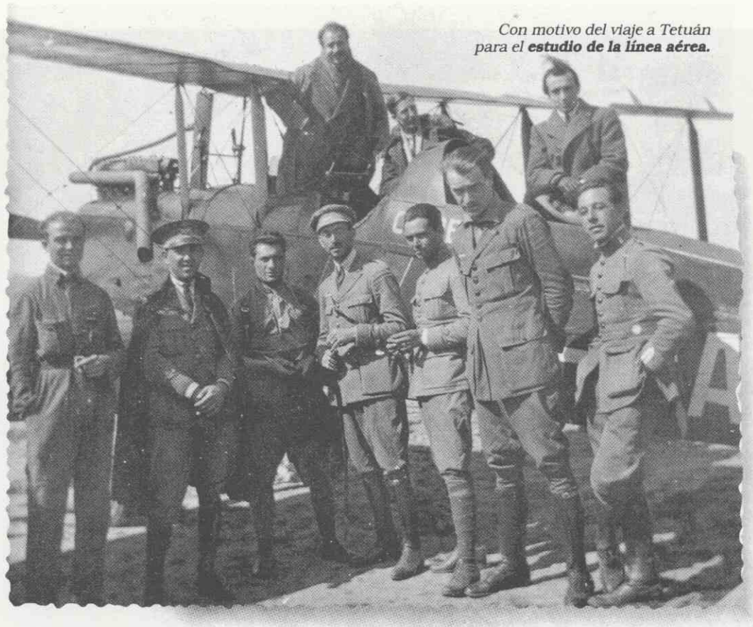
Con motivo del viaje a Tetuán para el estudio de la línea aérea.

Aviación y que cinco años después sería testigo directísimo de las primeras horas del raid del Plus Ultra.