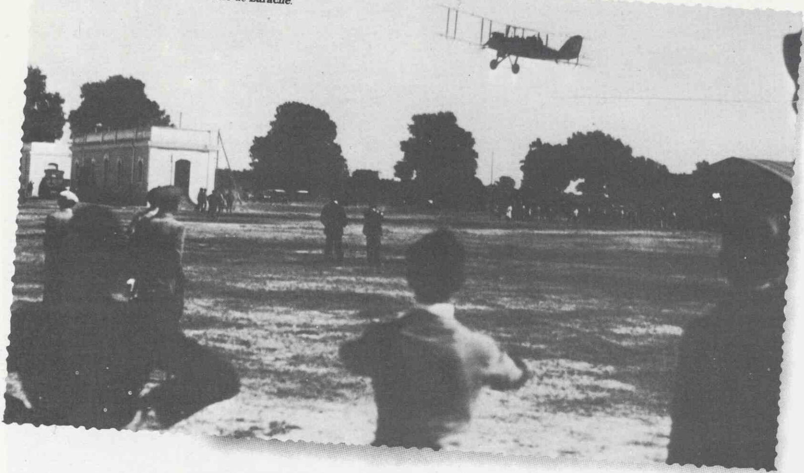
La llegada a Bu Ahmará, aerodromo de Larache.

merado de cosas: es un poco de rabia, un poco de vanidad, mucha testarudez y un vulgar placer deportivo: sobre todo, la exaltación de la propia fuerza física, que, no obstante, ahí no pinta nada.