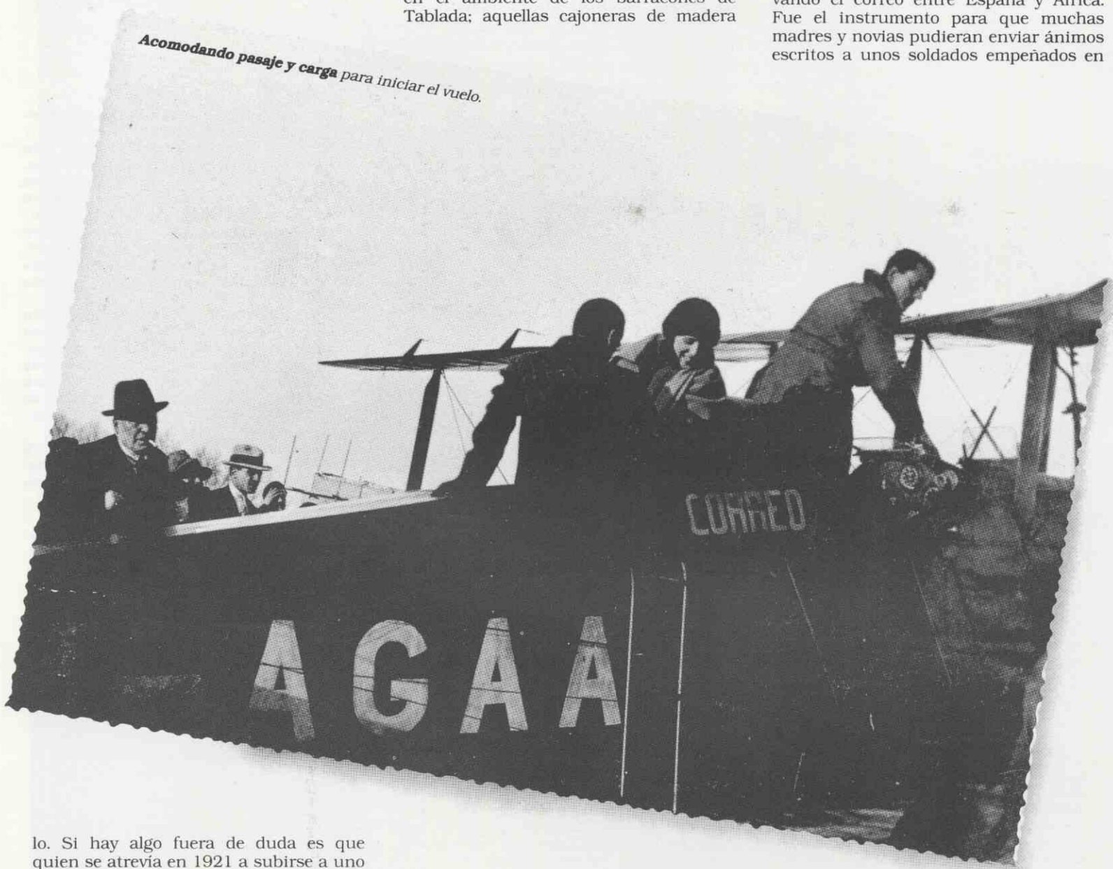
Acomodando pasaje y carga para iniciar el vuelo.

lo. Si hay algo fuera de duda es que quien se atrevía en 1921 a subirse a uno de los biplanos De Havilland, o conocía poco el miedo, o estaba dispuesto a vivir una aventura desconocida. Porque aventura era, desde luego, meterse de lleno en un mundo hasta entonces reservado a pilotos de guerra o acróbatas aéreos. Aventura era también, sin duda, la sensación de llegar a Tablada para que los pilotos le cubrieran con toda la parafernalia de ritual de gorros, guantes, gafas (los "más pesados cueros" como escribiría Saint Exupéry) y calzarse a duras penas en un habitáculo rodeado de cables y riostras en el que hacía arriba no se veía nada y hacía delante el disco plateado de la hélice era la única referencia. O, aún peor, meterse en el