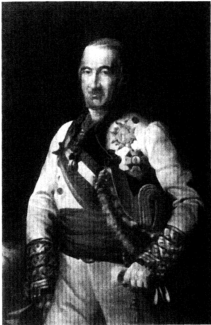
El General Castaños