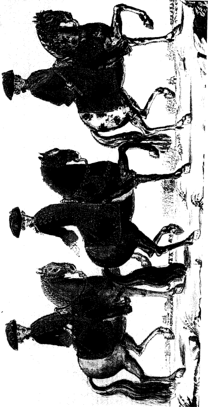
Uniformes de Mariscal de Campo, Teniente General y Capitán General en el siglo XVIII