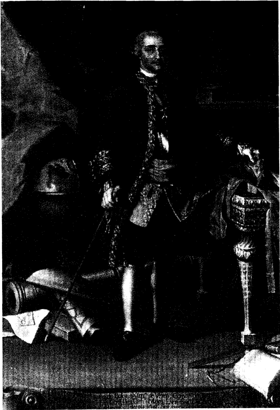
Retrato oficial del Conde de Aranda Museo Arqueológico Municipal. Huesca