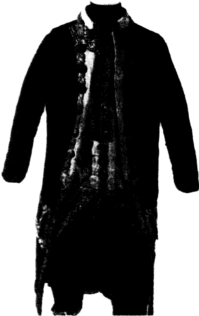
Casaca, chupa y calzones del Conde de Aranda