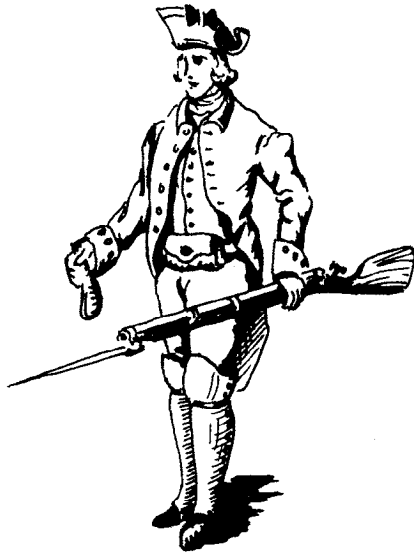
FUSILERO DE INFANTERIA, 1.768