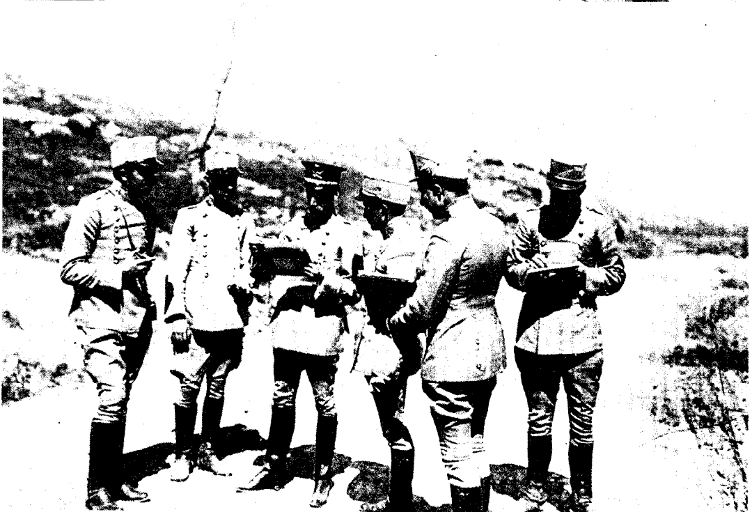
Jura de la Bandera (11-11-1923)