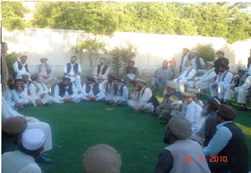
This photo is taken from a traditional Jirga. Esta foto está tomada de una Jirga tradicional.

Algunos afganos dicen que esto es bastante duro con la mujer. Otros dicen que no, que la tratarán bien porque sus parientes masculinos mantendrá un ojo sobre el estado de las cosas. Esta supervisión ayuda a las relaciones de cimentación entre las familias. Probablemente varía mucho según cada caso. Es importante señalar que el restablecimiento del equilibrio entre las familias es visto como más importante que castigar una afrenta individual . Bien podría ser la hermana del malhechor la que sea transferida a la familia de la víctima.