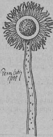
Figura 6. a — Aspergillus.

Cuando se procede al cultivo de estos microorganismos en medios apropiados para su desarrollo, nos demuestran siempre la estructura de sus diferentes órganos; pero en su vida íntima pudiéramos decir así; en la vida parasitaria, los aparatos de reproducción que dejamos indicados, están reducidos á su único filamento miceliano y nunca presentan sus esporos externos. Cuando un filamento miceliano normal encuentra condiciones contrarias á su